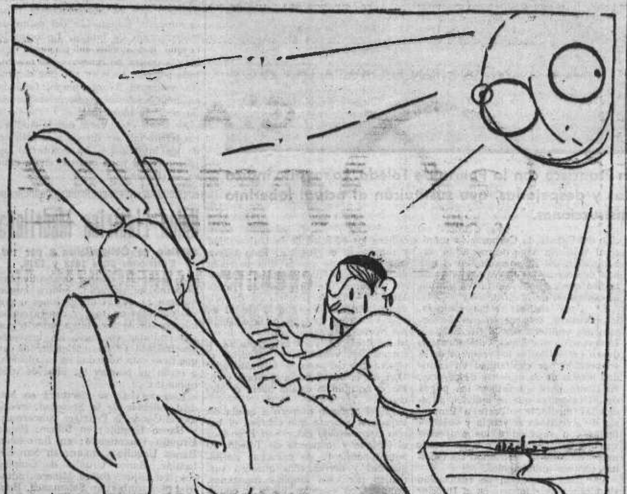
—¡La cuesta de agosto!