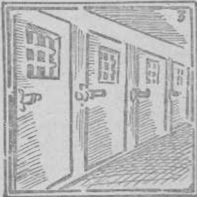
Rejas y celdas cerradas: quedaréis deshabitadas.