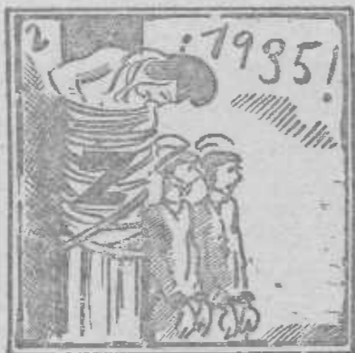
Año cruel y traidor. Ya se marchó, sí, señor.