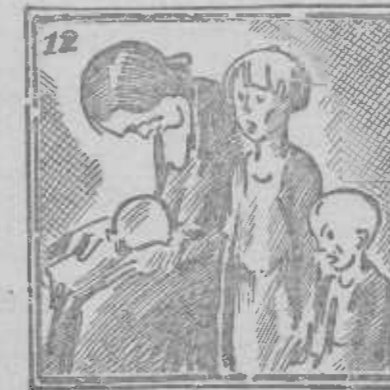
Y aquellos que no veremos, por su gloria lucharemos.