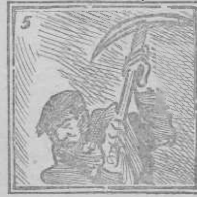
Ya te veo, labrador, trabajando con ardor.