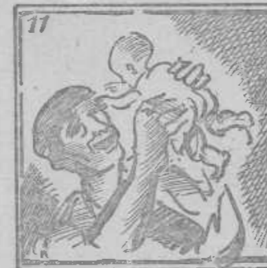
Olvida dolor, fatiga: vuelve de nuevo a la vida.