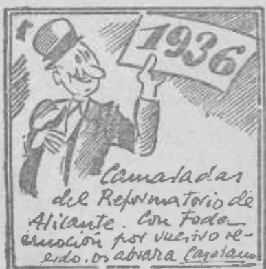
Otro será, ya veréis, el nuevo año treinta y seis.