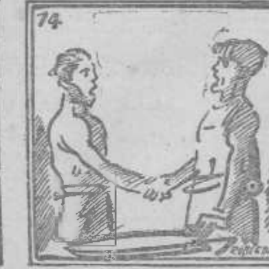
Compañero: en tu taller trabajas, como [ayer].