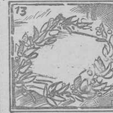
Para su memoria honrar, luchemos sin vacilar.