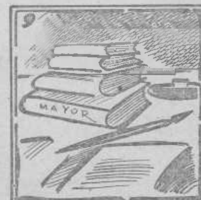
Periodista luchador: vuelve al puesto, triunfador.