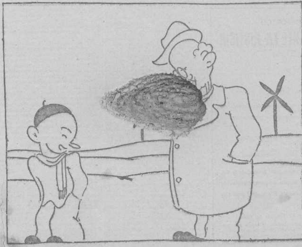
—Nada, don' Ale, fuera de guasa: ¡qué buen año se le presenta a usted!