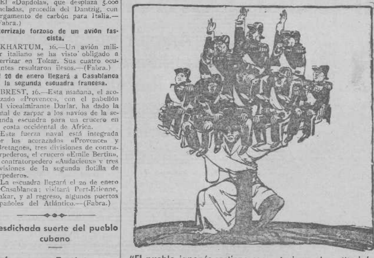
"El pueblo japonés sostiene con entusiasmo la actitud de sus representantes"