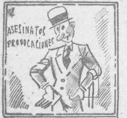
La derecha no escarmenta. Su provocación aumenta.