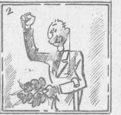
Así: mi enhorabuena; y por el muerto, mi pena.