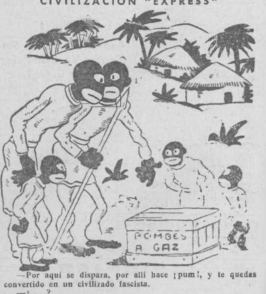
—Por aquí se dispara, por allí hace ¡pum!, y te quedas convertido en un civilizado fascista. —¿...? —Sí: te vuelves ciego y mudo.

extirpará radicalmente callos, durezas, verrugas, etc., usando el patentado Unguento Morrifit. Pueblo, 11. (Central de Espectáculos.)