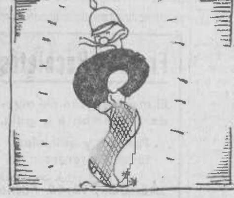
Buscan un Mussolinito que sea flamenco y bonito