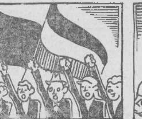
¡Francia! ¡Frente popular, que hace al fascio recular!