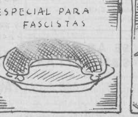
Y como sé que os irrita, algo de morcilla frita.