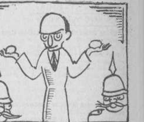
Y aquí, en España, Casares insiste en que dos son pares.