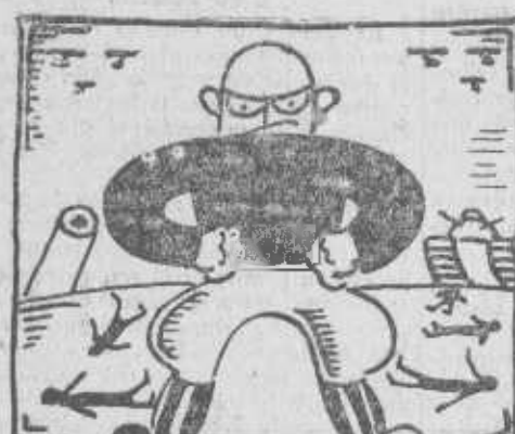
Mussolini (don Benito) deja a Gengis Kan chiquito

Se relaciona esta noticia con la procedente de Ginebra según la cual se está pensando en condiciones la villa que el negus posee en Suiza.