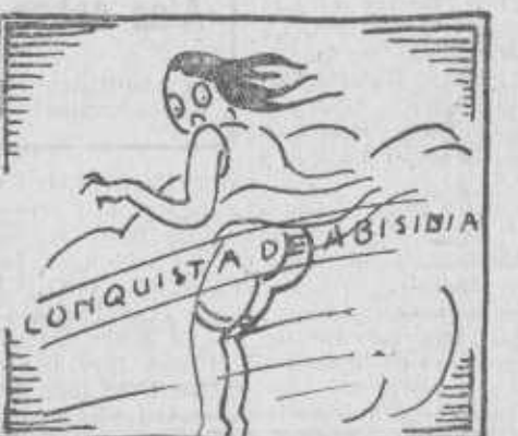
La Liga de las Naciones se quedó sin pantalones.