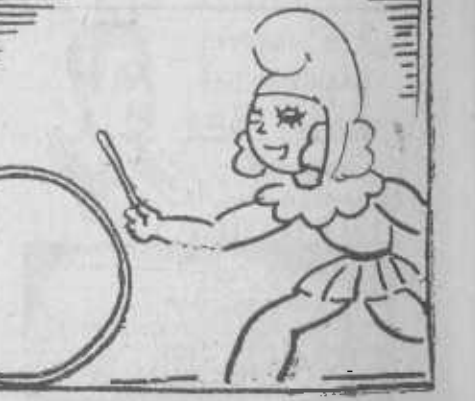
Entre tanto, con descaro, la Niña jugando al aro...