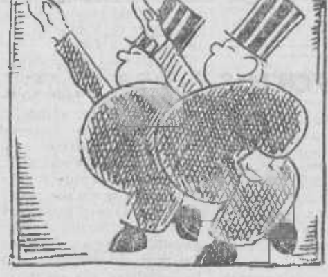
los clientes gordos de Herrera. (Pesuña negra y chistera.)