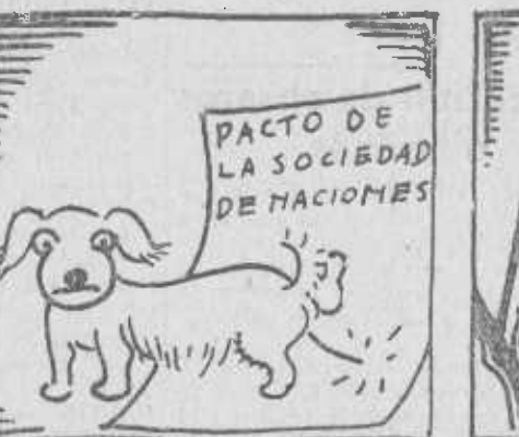
Y el fiero leopardo inglés ha hecho el perro pequinés.