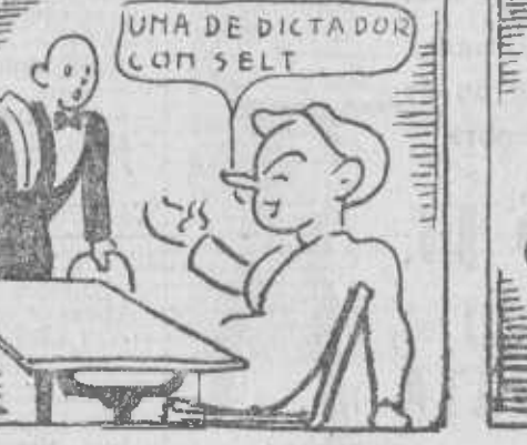
«¿En España dictadores? A mí con selts, sí, señores.»