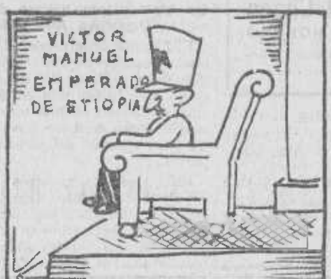
fundando imperios de arena. (Pesadilla es la taena.)