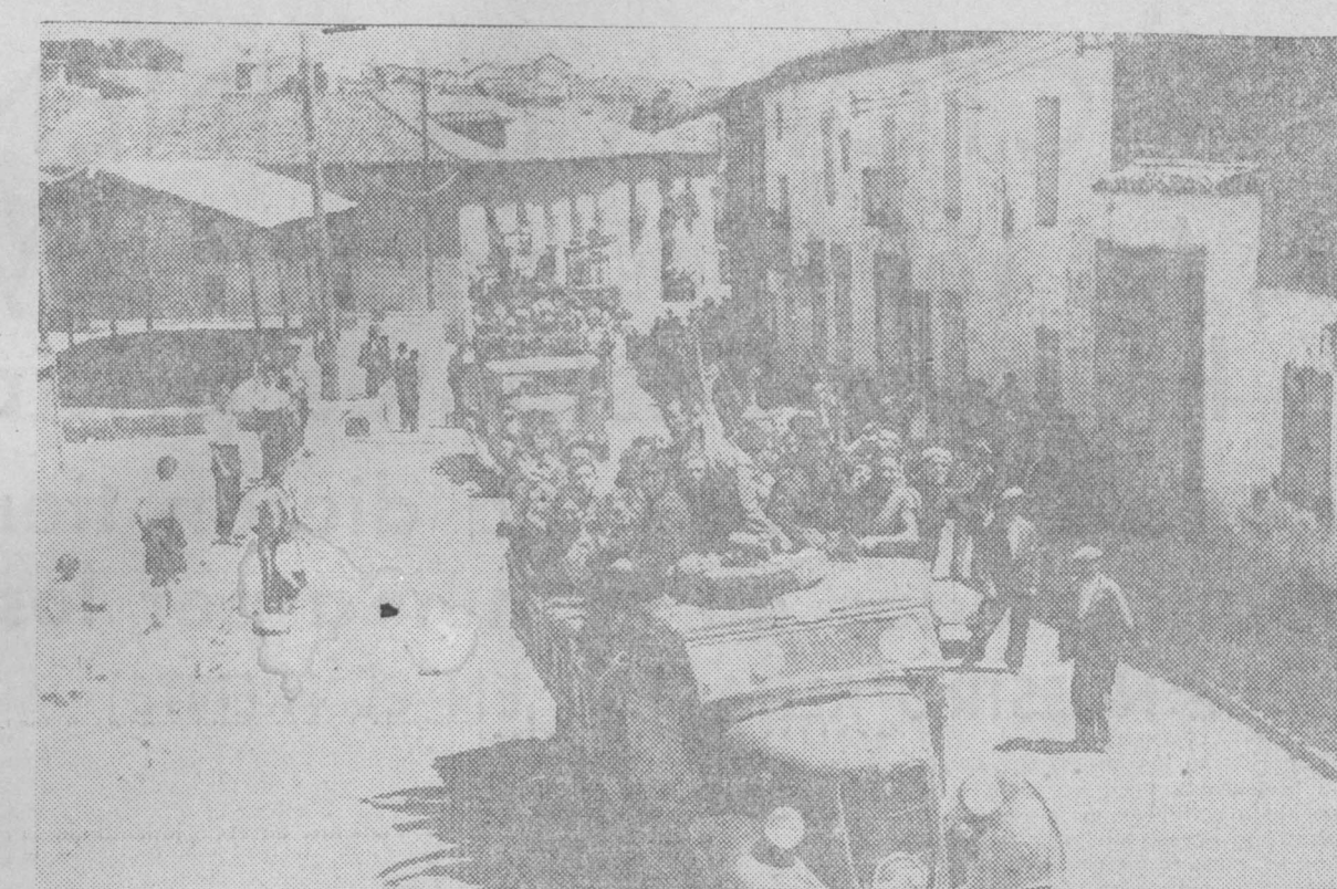
Milicias populares camino del frente de combate

El proceso de los traidores. BARCELONA, 31.—El juez especial ha dictado auto de procesamiento contra los generales, jefes y oficiales detenidos, y para la instrucción del procedimiento contra Goded y Burriel se han sacado testimonios de lo actuado, y dentro de dos días estará el sumario listo para elevarlo a plenario. (Febus.)