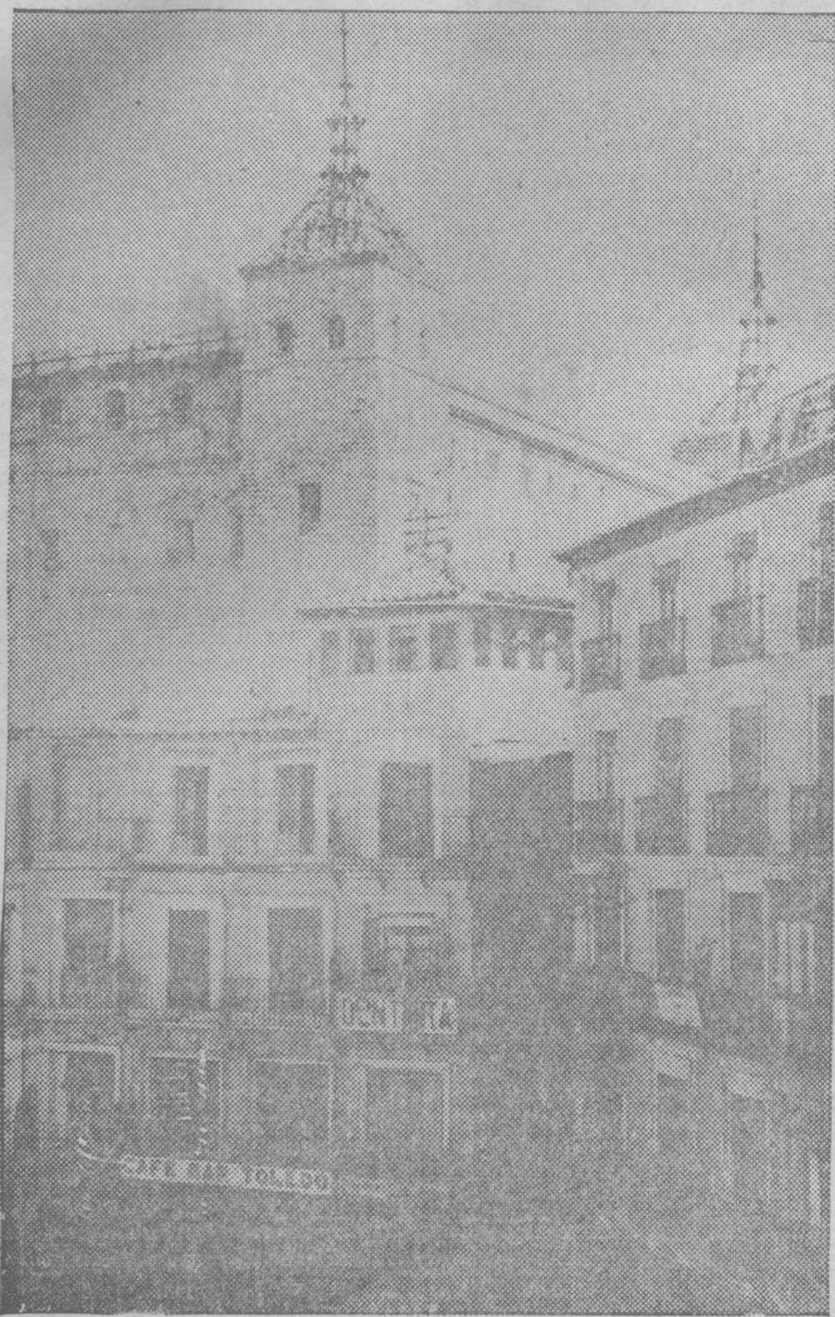
Interesante foto del Alcázar de Toledo, tomada desde un balcón de la plaza de Zocodover. En una ventana de la torre se ve una ametralladora