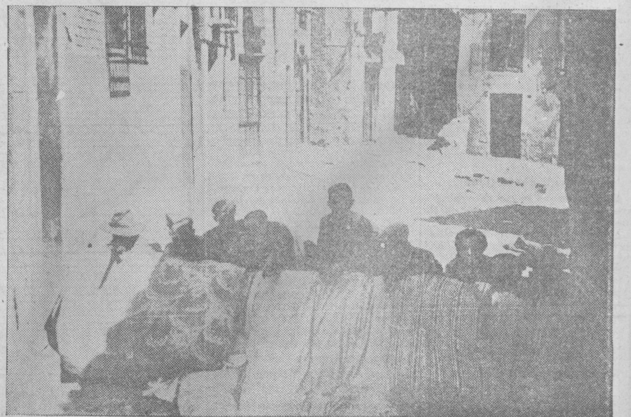
Vista de una barricada frente a la puerta del Alcázar, tomada con teleobjetivo