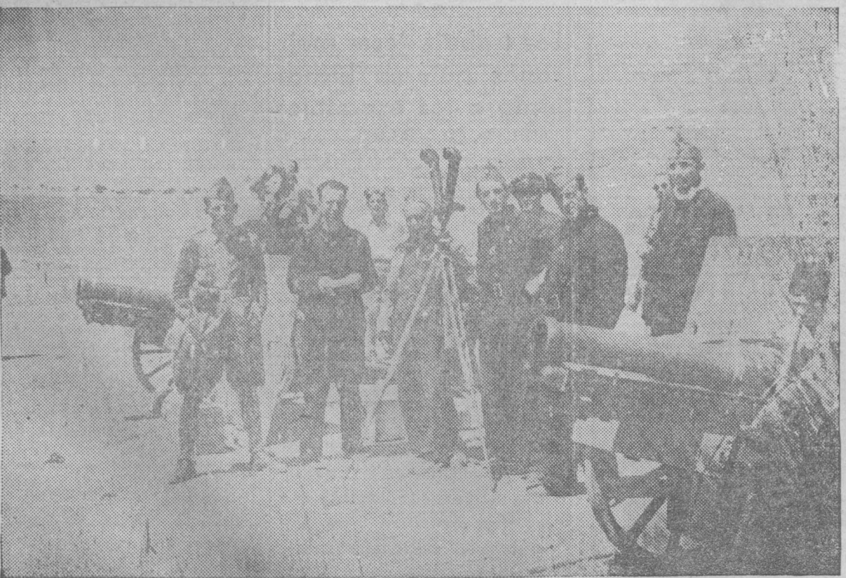
Los cañones de las fuerzas leales que enfilan el Alcázar de Toledo