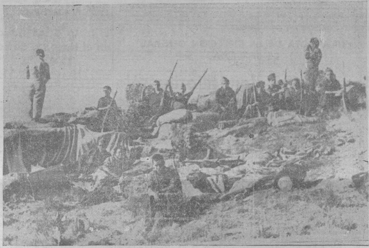
Una vez huido el enemigo, las avanzadillas, tranquilas, esperan las órdenes de jefe de la columna

BARCELONA, 31. — En el Palacio de la Generalidad han quedado depositados veinte millones de pesetas, en valores de la Deuda del Estado, que han sido encontrados por las fuerzas leales y Milicias en el Palacio episcopal de Gerona. También han sido entregadas a la Generalidad 20.000 pesetas en billetes de Banco.