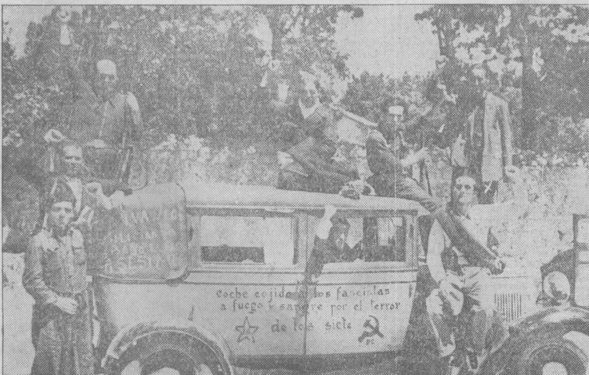
El alcalde de Navalperal (x) con el automóvil cogido a los facciosos en el brillante combate librado por la columna del teniente coronel Mangada

Han atravesado la frontera del norte cincuenta y dos religiosos que estaban en el Colegio de Tuy (Pontevedra). Según ellos, aquella zona está ocupada por las Milicias y fuerzas gubernamentales, y, temiendo excesos, los frailes han evacuado el convento. — (Diana.)