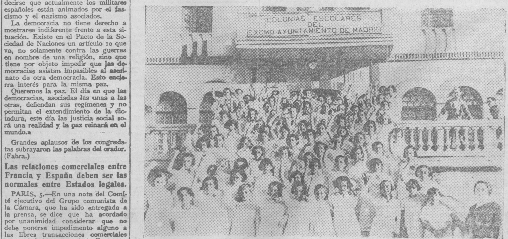
Las niñas madrileñas que figuran en la Colonia escolar de Arenas de San Pedro, gozan todas de perfecta salud y dan jubilosos vivas a la República y a las tropas leales que las salvaron de las garras fascistas