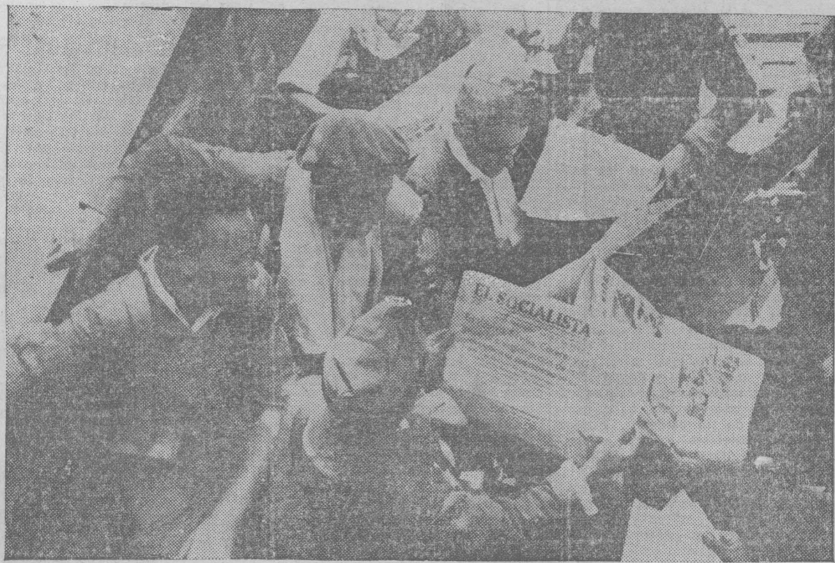
Los milicianos leen con vivez la prensa madrileña