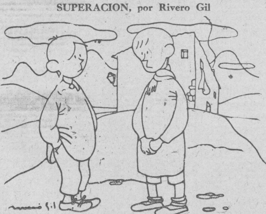
—¿Quién fuera hombre...! —¿Para ser asturiano?

Ningún antifascista madrileño debe desconocer el manejo de las armas. ¡Inscríbete en las Escuelas de preparación militar del Frente Popular!