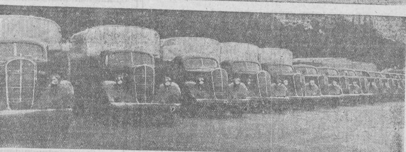
Algunos de los camiones regalados a Madrid por el Fondo de Solidaridad Internacional.