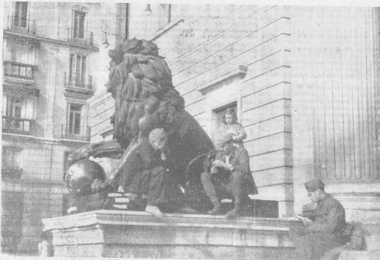
Milicianos convalecientes de sus heridas que, al socaire del león parlamentario, esperan gozar del sol.

OSLO, 2.—El periódico obrero «Arbeider Bladet» dice: «Hitler tiene un espíritu medieval y una oscuridad intelectual exponente de la Alemania nazi.» (Fabra.)