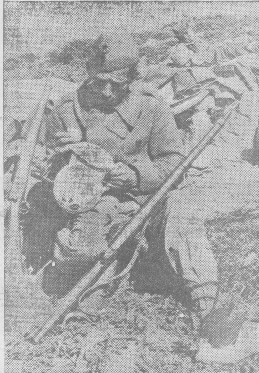
Cuando se hace la guerra, cuando el fusil se ha hecho naturaleza en el miliciano, el arreglo de un jarro averiado puede constituir, en un descanso, una preocupación de importancia capital...