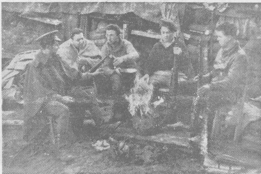
Se brinda en las chabolas, al calor de la lumbre. Y apostaríamos que este brindis es un anticipo de unas balas certeras en cuanto asome el enemigo.