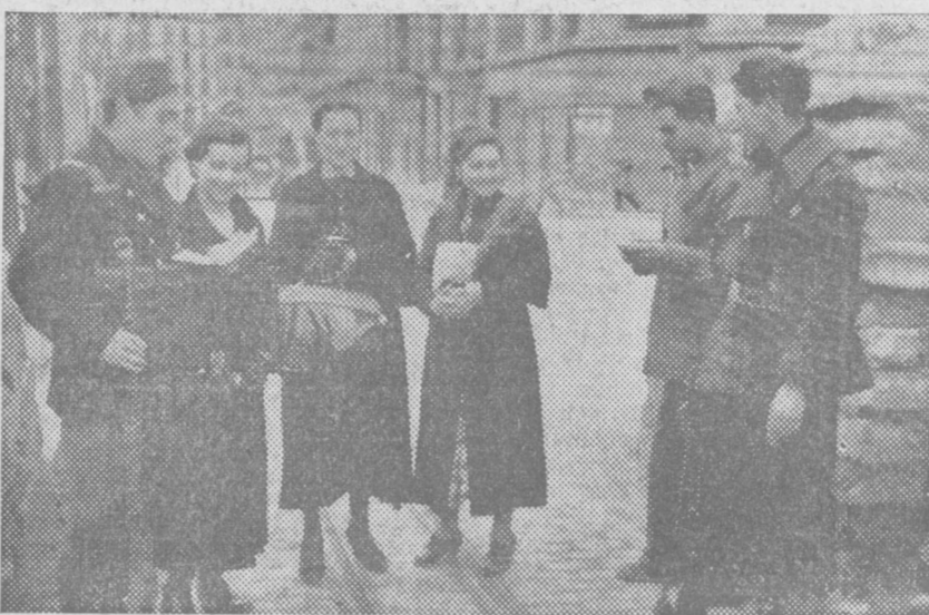
Son vecinas del barrio de Argüelles que solicitan su acceso. ¿Qué ha quedado de la casa abandonada? El sentimiento hogareño, tan poderoso en la mujer, no se resuelve a despedirse, aunque sea circunstancialmente, del hogar querido.