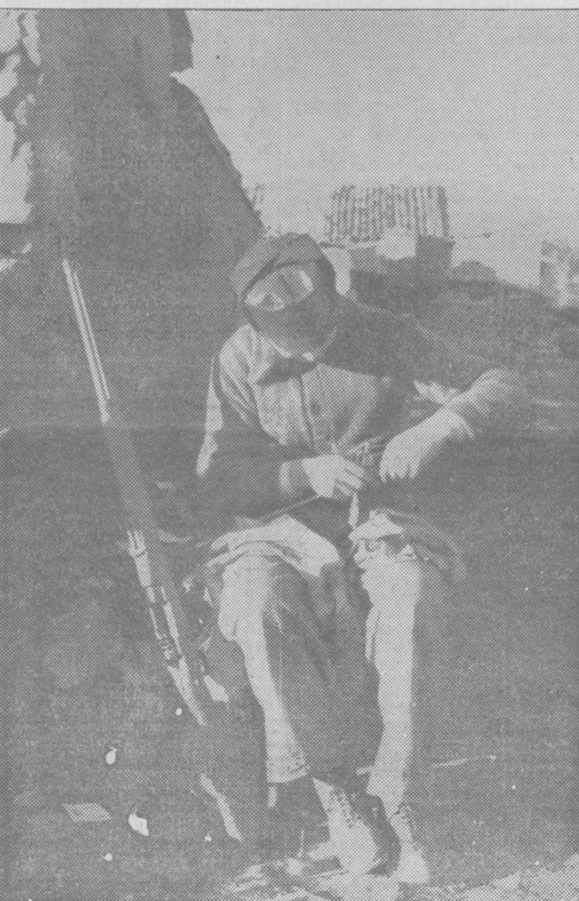
Al fusil se le mimó, se le cuida. Es el compañero del soldado. Y no cabe duda de que responde agradecido a la solicitud con que se le trata.