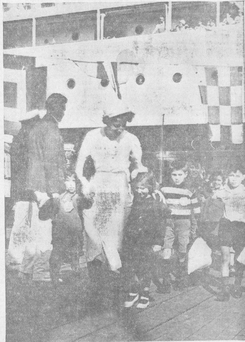
A su llegada a la U. R. S. S., los niños españoles son cariñosamente atendidos y encaminados a los lugares en donde, con la manutención física, hallarán el pan de una cultura fundada en auténticos y ya triunfales postulados socialistas.