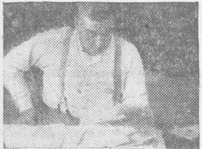
Ramón González Peña, presidente del P. S. O. E.

Insertamos hoy los textos de algunas de las resoluciones adoptadas por el Comité Nacional en sus reuniones de estos últimos días. Publicaremos las demás en días sucesivos, según lo consienta el espacio disponible dentro de la actual limitación de nuestras páginas.