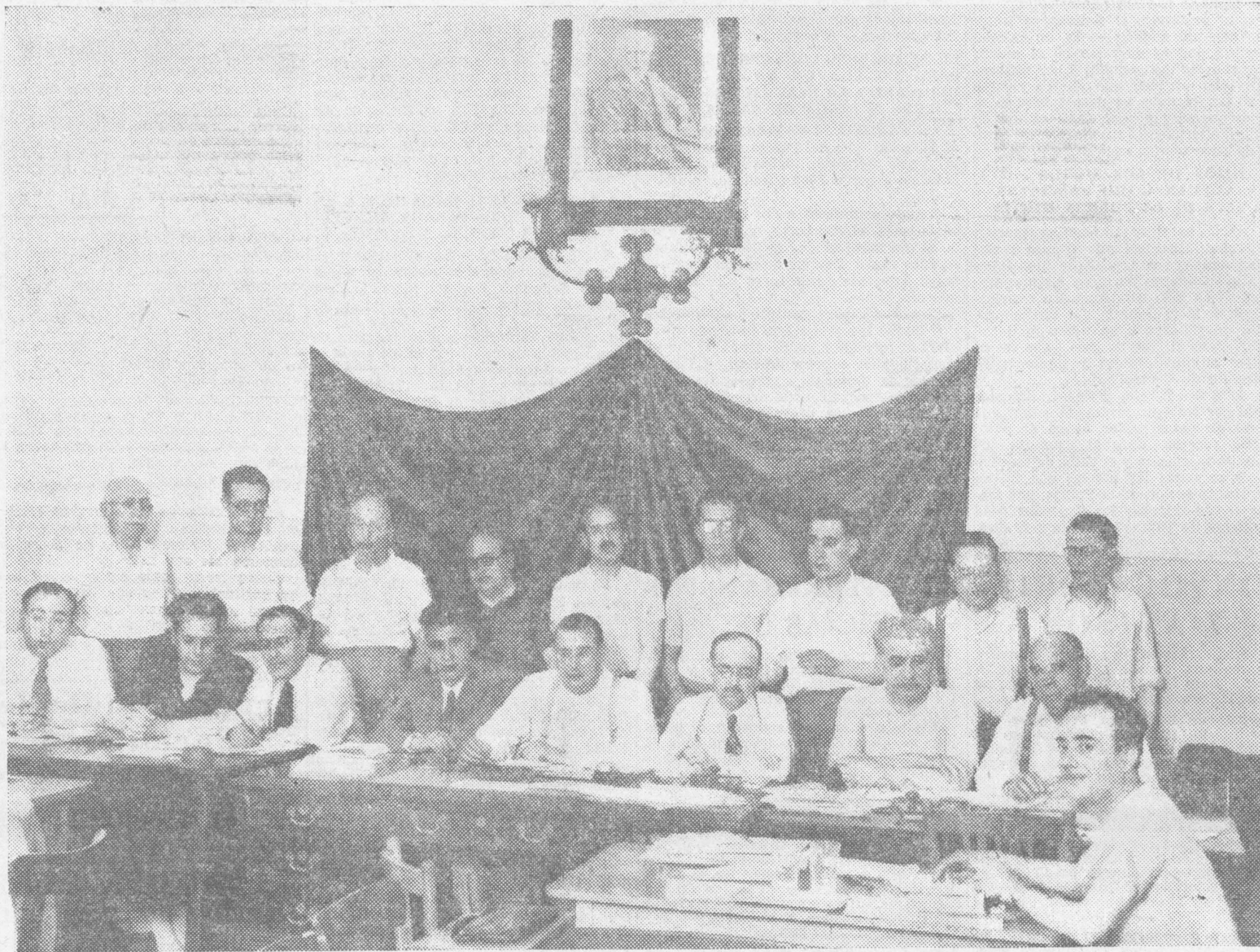
La Comisión Ejecutiva y un grupo de delegados, en la Mesa presidencial

ros sin más límite que el de explotados en la misma industria, y menos en ocasión como la presente, en que enormes masas de trabajadores, antes indiferentes u hostiles, tienen que ser admitidos en la organización, sin poder esperar a que madure en ellos una clara conciencia de clase. No solamente no puede confiarse a multitudes bisonas que sean guardianes de la ruta de la revolución, sino que, por el contrario, hay que adoptar medidas precautorias para que no la desvien ni la confundan, ni se conviertan en jueces ligeros de quienes los libraron de la opresión y de la miseria. He ahí una de las misiones urgentes de nuestros Grupos Sindicales, que no deben faltar en ningún Sindicato, por lo que, donde no existan, deben crearse rápidamente. Estamos seguros de que ningún socialista, desde la dirección del Sindicato, se deje seducir por una corriente sindicalista que niegue nuestro ideario, precisamente cuando se trata de entrar en una época de realizaciones socialistas. Los