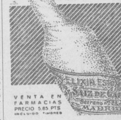
VENTA EN FARMACIAS POR 5 Ptas. INCLUIDO IVA.

Medicamento de sabor agradable, inofensivo siempre en todas las edades, y de resultados positivos para curar el dolor de estómago, acidez, vómitos, malas digestiones, diarreas en niños y adultos, etcétera, etc.