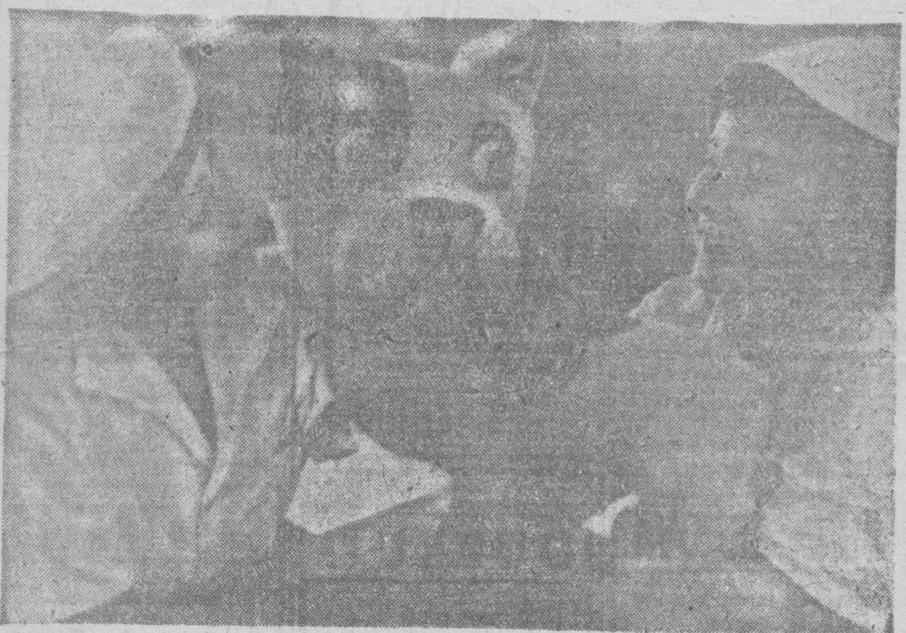
Dos niñas españolas solazándose en una de las residencias instaladas en la U. R. S. S., lejos de los asesinos que miran la vida infantil como preferente objetivo militar