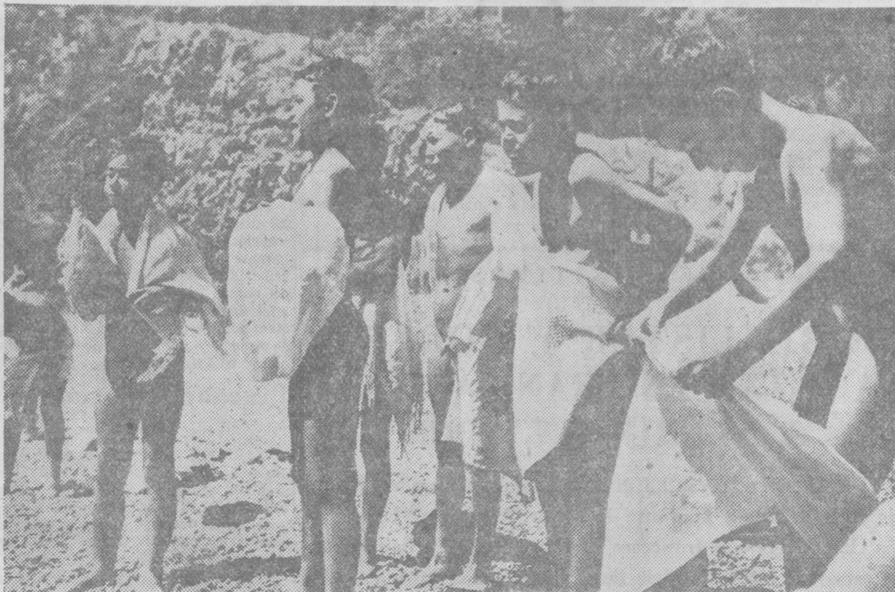
Baños de sol y aire libre en una de nuestras guarderías infantiles