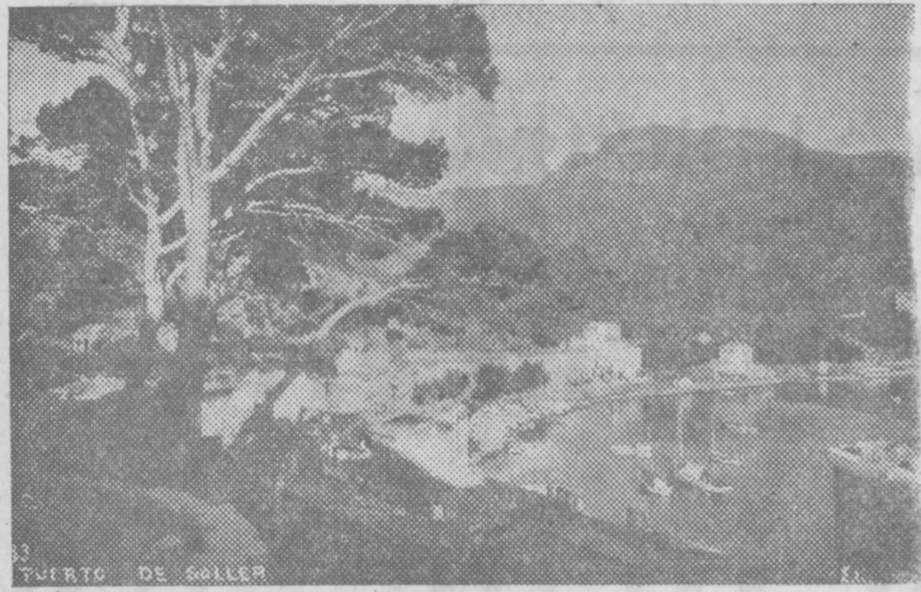
Un puerto de Mallorca, la isla invadida por Italia, a ciencia y paciencia de Inglaterra