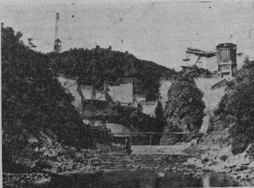
El monumental pantano del Aguila

—Casi van a alcanzar los 100 metros de altura proyectados—nos dice uno de ellos—. Y no