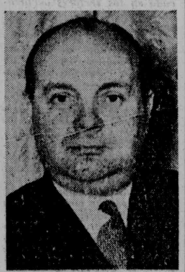
Paul H. SPAAK