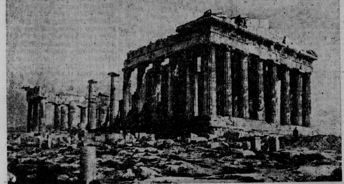
ATENAS. - El Partenón, vista general, del lado oeste.