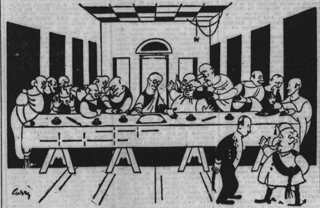
Franco.— Cada vez que tengáis necesidad de un Judas... (Cartoon published with equal title and by «Franc-Théâtre», de París, el 5 de abril de 1949 y que recobra hoy, después de la Conferencia de Ottawa, plena actualidad.)