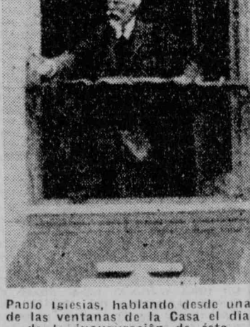
Pablo Iglesias, hablando desde una de las ventanas de la Casa el día de la inauguración de ésta