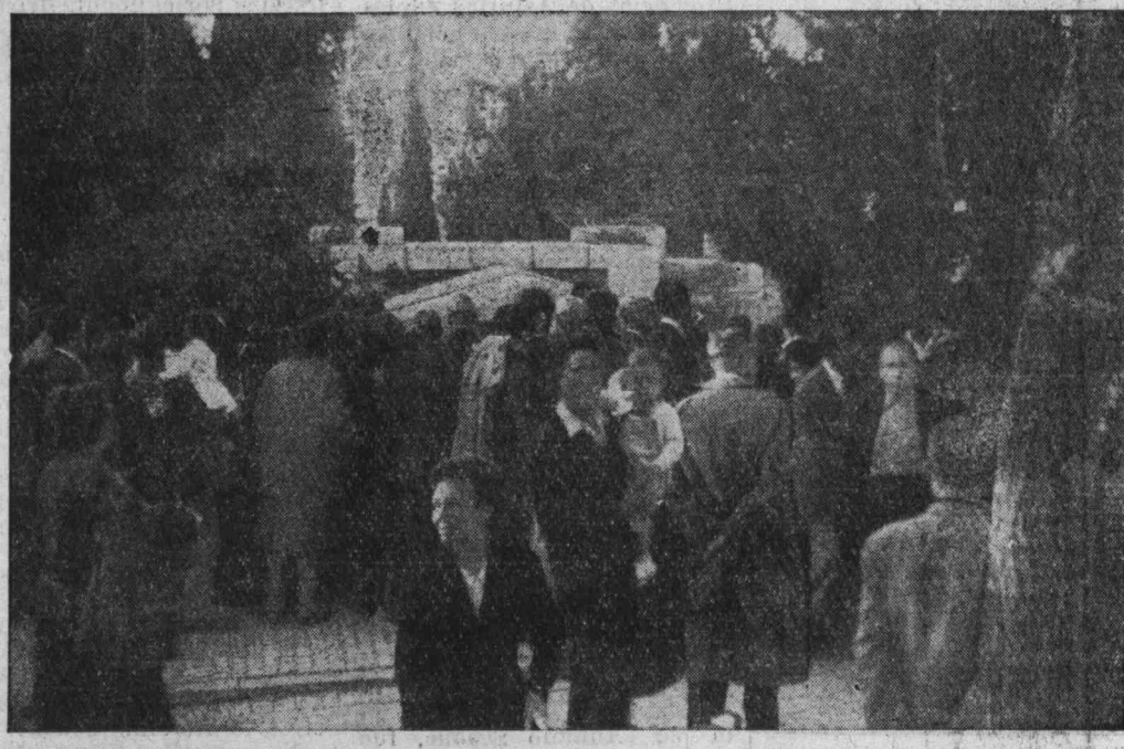
La tumba de Pablo Iglesias, en el Cementerio Civil de Madrid, el pasado día 1 de noviembre. Los visitantes forman cola para besar la cabeza en piedra del maestro.

Cuando el régimen del Caudillo sea un infamante pa- sado, los discípulos de Pablo Iglesias, formados muchos de ellos uno a uno bajo la opresión y en la soledad de la reflexión y del estudio, constituirán una gran esperanza para España, a la manera de esas flores que, llevadas calla- damente una a una, cubren hoy, después de tantos años, la tumba del maestro.