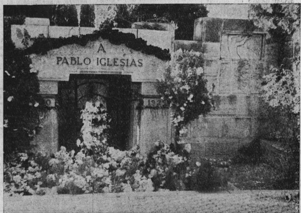
La tumba de Pablo Iglesias cubierta de flores. Fotografía tomada el pasado día 3 de noviembre.