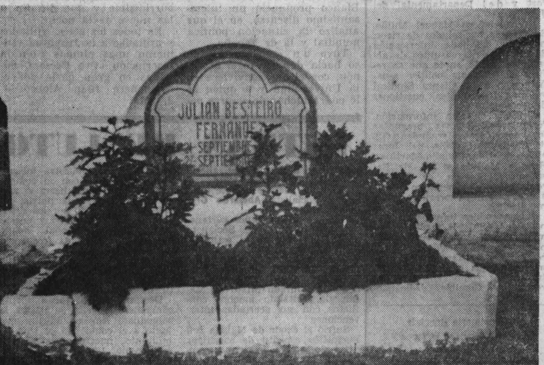
La tumba de Julián Besteiro en el Cementerio Civil de Carmona (Sevilla).

LAS COMISIONES EJECUTIVAS DEL P. S. O. E. Y DE LA U. G. T.