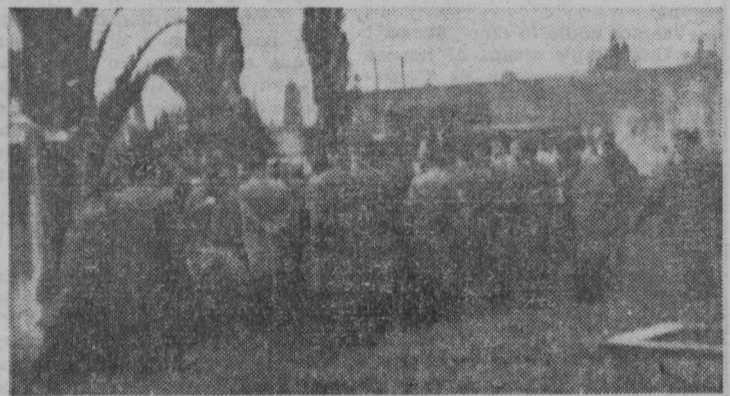
JOVENES Y VETERANOS SOCIALISTAS BILBAINOS

en el cementerio de Derio (Bilbao) ante la tumba de Tomás Meabe, en el homenaje que el 28 de noviembre pasado rindieron al fundador de las IJ. SS. con motivo del cincuentenario de su muerte