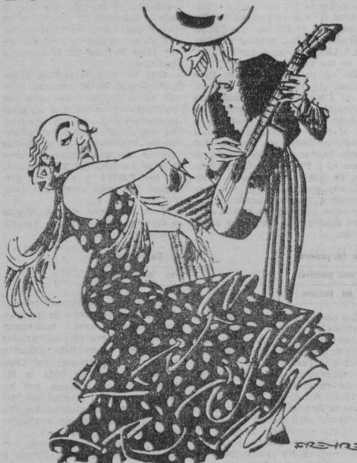
--Bien pagaa, bien pagaa...