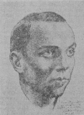
Miguel HERNÁNDEZ por Antonio BUERO VALLEJO

EL PADRE DE MIGUEL Hernández se llamaba también Miguel y era pastor y tratante en cabras. Desde pequeños, nuestro poeta cuida los rebaños de su padre. No asiste a ninguna escuela. Sin embargo, Miguel encuentra en la Naturaleza que se