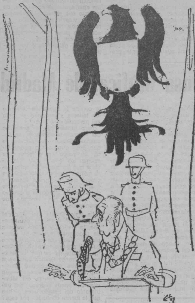
(Dibujo de Edw. Lindahl.)