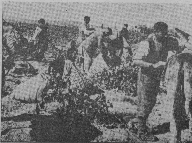
Los viticultores reclaman 300 pesetas diarias de salario mínimo.

En cuanto a los jefes « sindicales », son los que con más ahínco se oponen al reconocimiento del derecho de huelga. Están en su papel, son agentes del Estado totalitario García Ramal, delegado nacional de Sindicatos, no ha dejado la