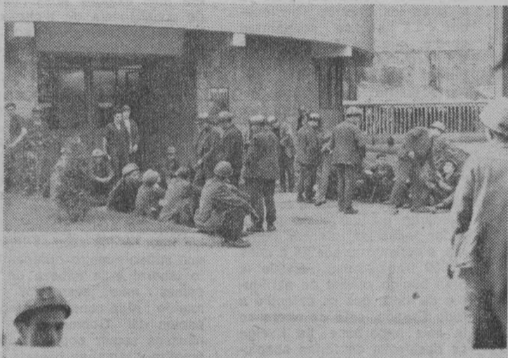
Mineros de « Carbones Asturianos » en huelga.

« EL GOBIERNO ha examinado los principales temas nacionales y considera oportuno formular una declaración que recoja las directrices en que quiere inspirar su labor para la promoción de un orden social justo en el que todo interés particular quede subordinado al bien común de los españoles. « El Gobierno afirma el propósito de acentuar su política social a todos los niveles, procurando el perfeccionamiento de las relaciones laborales y de la seguridad social ; sostener el