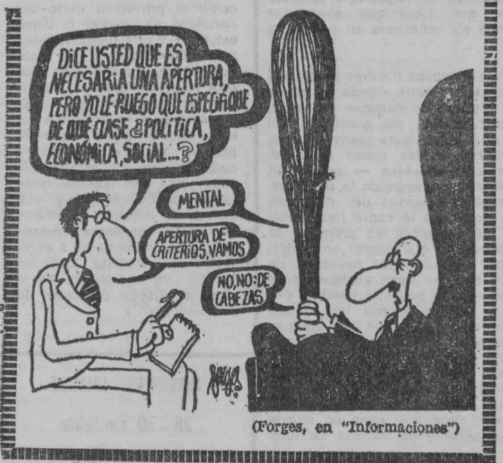
(Forges, en "Informaciones")