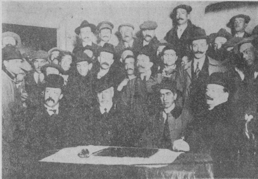
Pablo Iglesias rodeado de compañeros y envuelto en la capa que los calumniadores convertirían en abrigo de pieles.

El mercado es un campo de batalla donde esgrimen sus armas los capitalistas. La ley del mercado es la competencia, principio fundamental de la economía política burguesa. El consumidor, que es un ser insensible, deja a la puerta del mercado toda clase de sentimientos y simpatías y sólo lleva un objeto: el de comprar lo mejor y más barato. La consecuencia inevitable de este hecho es que aquel que cuenta con mejores armas sale vencedor en el combate. La grande agricultura, la grande industria y el gran comercio vencerán siempre en esta lucha a la pequeña agricultura, a la pequeña