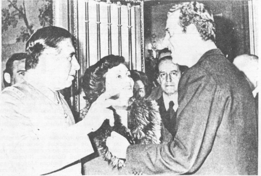
Pinochet: la visita mas coherente.

La coherencia, a pesar de todo, acabó por imponerse. A los pocos días de la coronación, y en respuesta a las primeras demandas populares de libertad, el régimen juancarlista contestó con la represión y la violencia: los detenidos en el Cementerio civil de Madrid y en Carabanchel, la prohibición de actos, la vio-