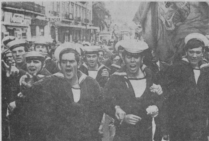
El ejército fué el factor determinante de la nueva situación en Portugal. ¿Será también factor determinante de otra «nueva» situación?

Pero, ¿será este el último intento? Es cierto que cada día que pasa se eliminan progresivamente las posibilidades de involución; sin embargo, el pueblo portugués deberá permanecer vigilante para no perder las conquistas realizadas.