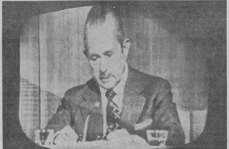
La entristida de Arias por televisión fué especialmente dirigida a tranquilizar a la « familia de El Pardo », y obtener luz verde en el reajuste que se avenicaba.