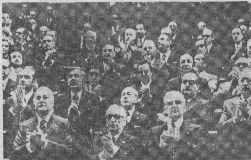
Prórroga para seguir aplaudiendo.

Las asociaciones únicamente representan al régimen fascista de Franco, y sus componentes son los mismos que en la actualidad, de una u otra forma, se en-