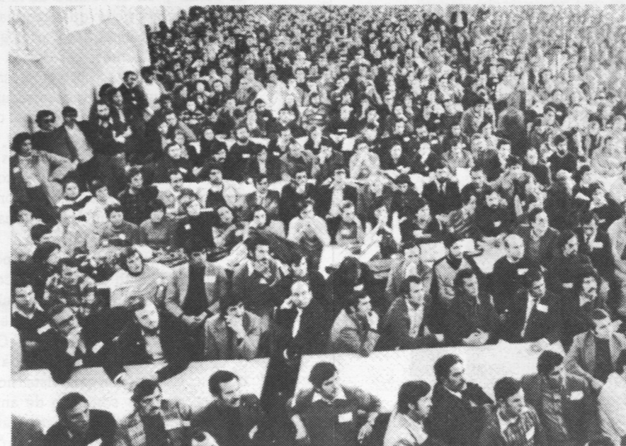
Los trabajadores deciden ir a la huelga en la asamblea de fábrica.

La fuerza o la imposición se verán correspondidas siempre por el instrumento más eficaz que posee el movimiento obrero —la huelga—. ■