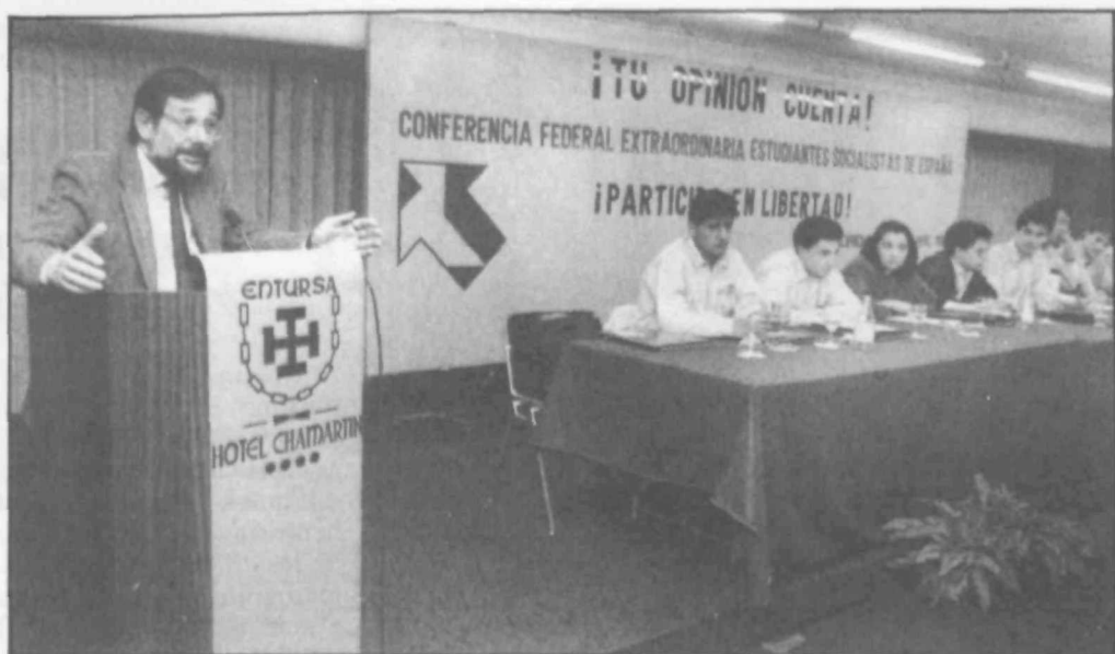
Conferencia Federal Extraordinaria de Estudiantes Socialistas de España