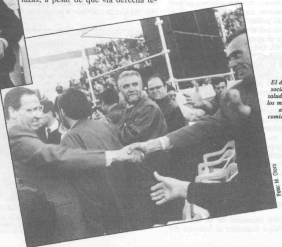
El dirigente socialista es saludado por los militantes antes del comienzo del mitin.

Sólo el Partido Socialista garantiza un futuro de progreso, ofreciendo soluciones a las nuevas demandas sociales, tanto en materia de vivienda como de seguridad ciudadana y de lucha contra la droga