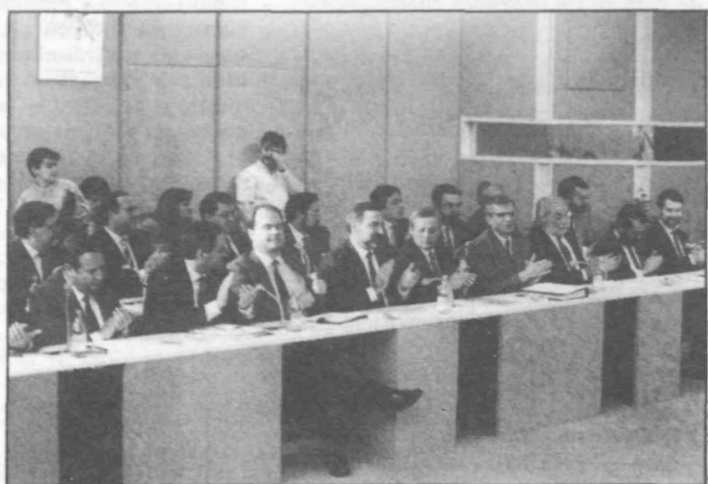
La reunión contó con la presencia de los secretarios generales regionales del partido, los presidentes de CC.AA. gobernadas por el PSOE, así como los alcaldes y candidatos de las grandes ciudades españolas.

Finalmente, se modificará la regulación de las cuentas de ahorro-vivienda a los efectos de relacionar el régimen fiscal de las mismas con la provisión posterior de financiación para la adquisición o rehabilitación de vivienda propia.