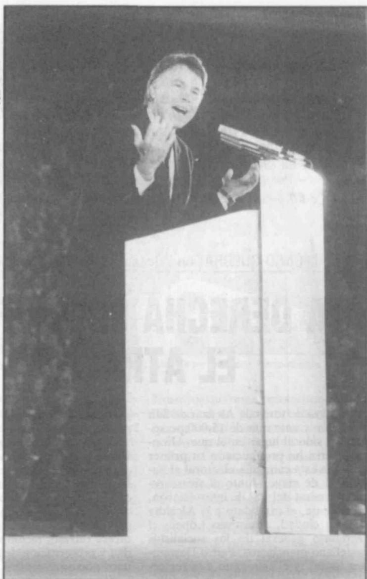
Felipe González, durante su intervención en el mitin de Valencia.