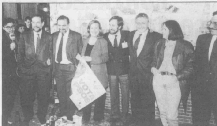
Militantes y simpatizantes del PSOE acudieron a la tradicional pegada de carteles en apoyo a los candidatos del PSOE a la Presidencia de la Comunidad y a la Alcaldía de Madrid.

El presidente castellano-manchego puntualizó, igualmente, que unas elecciones no se pierden ni se ganan en quince días de campaña, sino «con la credibilidad del trabajo diario, los resultados de una gestión y un programa electoral que responda a las necesidades de los ciudadanos». José Bono concluyó afirmando que «el PSOE es el único partido que puede garantizar la consolidación de todo lo conseguido hasta ahora, impidiendo la vuelta a un pasado histórico que sólo añoran unos pocos. Por eso aseguramos en nuestro lema que votar al PSOE es una decisión de progreso».