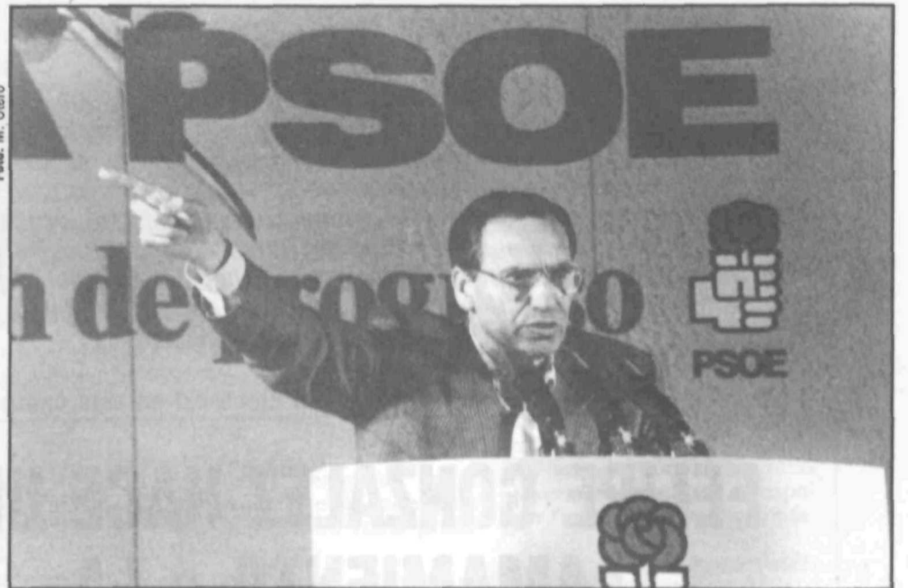
Alfonso Guerra intervino en su primer mitin de campaña en Alcázar de San Juan.

El vicesecretario general del PSOE argumentó, asimismo, que sólo este partido garantiza un futuro de progreso, ofreciendo soluciones a las nuevas demandas sociales, tanto en materia de vivienda como de seguridad ciudadana y de lucha contra la droga. «Por eso es importante que el Partido Socialista continúe gobernando. Hay que evitar que la derecha retrase el avan-