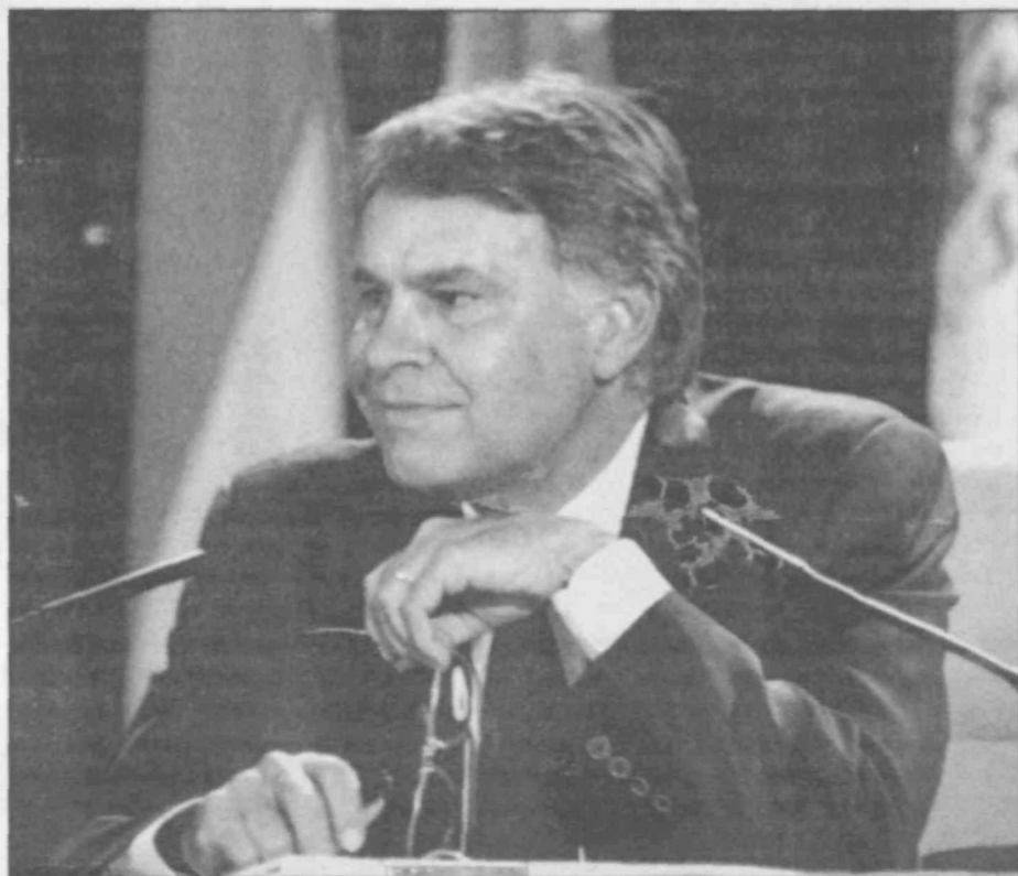
Felipe González durante la rueda de prensa al finalizar la Cumbre.

Otros mandatarios, como el ecuatoriano, Rodrigo Borja; el boliviano, Paz Zamora, y el guatemalteco, Jorge Serrano, defendieron la educación bilingüe, mientras que Patricio Aylwin se quejó de la ausencia de una conciencia iberoamericana en los libros de texto. Por otra parte, el Presidente de Paraguay, Andrés Rodríguez, propuso la creación de una fundación para estimular la lectura de jóvenes y