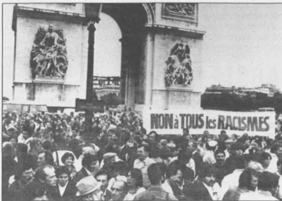
En Francia son frecuentes las campañas y manifestaciones contra el racismo.

Habría que comenzar destacando que, según un informe elaborado a instancias del Parlamento Europeo, actualmente, del total de 320 millones de ciudadanos que viven en la Comunidad Europea, trece millones son inmigrantes. De éstos, cinco millones son naturales de Estados comunitarios, mientras que el resto, ocho millones, proceden de países no pertenecientes a la Comunidad. De estos últimos, casi dos millones