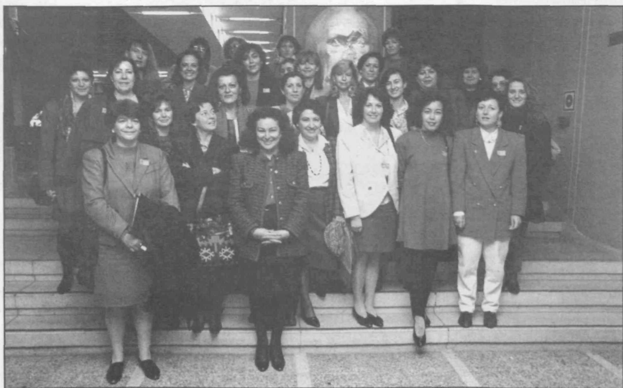
La mayor presencia de la mujer en el Partido, unido a la cuota del 25 por 100, han facilitado el acceso paulatino de las mujeres a cargos de responsabilidad política.

Por último, y de cara al mercado único europeo, con su libre circulación de bienes y servicios culturales, destacó la necesidad de articular con eficacia las actuaciones de los Ministerios de Cultura, Educación y Ciencia y Asuntos Exteriores, con el fin de dar a conocer más intensamente nuestras manifestaciones artísticas en Europa y a la vez afianzarlas y fomentarlas en nuestro país.