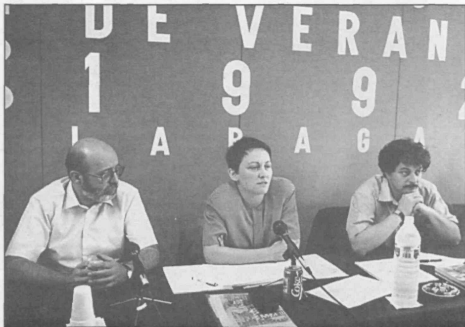
Matilde Fernández, en la apertura del curso, junto al secretario de Formación del PSOE, José Félix Tezanos, y el director del Instituto de la Juventud, Magdy Martínez Solimán.

La ministra, que manifestó que «la formación para el empleo conforma una estrategia básica en la integración de los jóvenes», señaló, por otra parte, la necesidad de que la juventud se implique en mayor medida en la creación y desarrollo de las políticas generales del país y en las sectoriales, participando en el movimiento asociativo y en el marco de los partidos políticos.