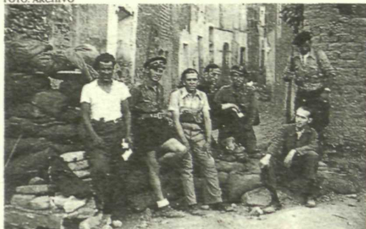
Los militares republicanos podrán continuar cursando solicitudes para obtener su pensión.