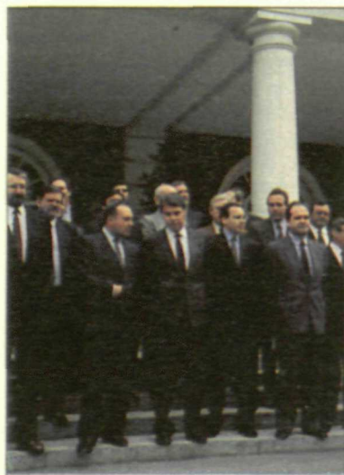
Los secretarios regionales del PSOE analizaron con Felipe González el método de elaboración del programa socialista.

A ún cuando el PSOE trabaja con la perspectiva de la celebración de las elecciones en otoño y la preparación de su Programa no se ultimarán hasta el verano, ya se han dado a conocer, en las últimas semanas, algunos de los ejes sobre los que girarán las propuestas