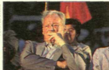
El PSC-PSOE organizó un homenaje a Willy Brandt.