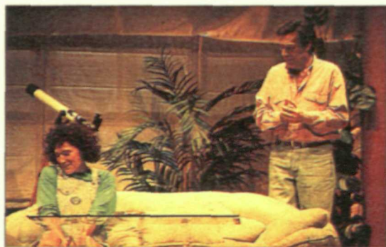
«La mujer de mi vida» es una comedia con imaginación e ingenio.