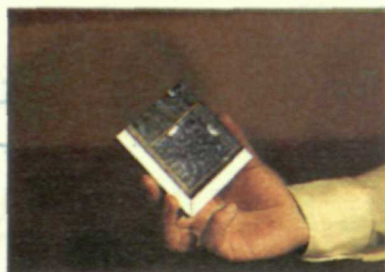
En estos años la inversión en Ciencia ha aumentado espectacularmente.

E l Ministerio de Educación y Ciencia va a destinar cerca de 100.000 millones de pesetas, procedentes de los Fondos Europeos de Desarrollo Regional (FEDER), a programas de I+D (Investigación y Desarrollo) entre 1994 y 1999. Una de las novedades de este programa de aplicación de los fondos FEDER, cuyo principal objetivo es corregir los desequilibrios regionales, consiste en aumentar los con-