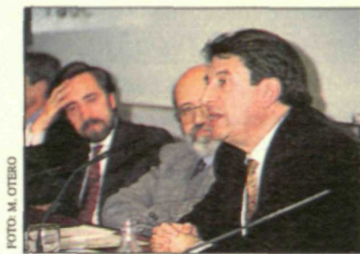
Francisco Vázquez y Juan Barranco hablaron sobre democracia municipal.

En el debate sobre «Democracia Municipal», el alcalde de La Coruña y Presidente de la Federación Española de Municipios y Provincias, Francisco Vázquez , y el concejal en el Ayuntamiento de Madrid, Juan Barranco , coincidieron en apuntar la necesidad de dar a los ayuntamientos un mayor peso específico, dotándoles de las competencias y de los recursos económicos suficientes para atender las demandas que los ciudadanos plantean a este nivel de la administración.