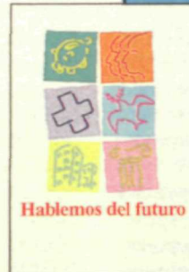
Hablemos del futuro

bajo el lema «Hablemos del Futuro». «Debemos hacer un enorme esfuerzo de comunicación con los ciudadanos, y cuando ésta no sea posible por una vía debemos hacer una comunicación puerta a puerta o boca a boca», ha asegurado Felipe González, para explicar la oportunidad de esta acción, que tiene por objeto el detectar las demandas de los ciudadanos sobre cuestiones tan específicas como la renta personal, el empleo, la sanidad, la seguridad ciudadana, la vivienda y la educación. En el desarrollo de este trabajo «puerta a puerta» está prevista la movilización de más de 50.000 militantes, quienes visitarán, aproximadamente, medio millón de hogares.