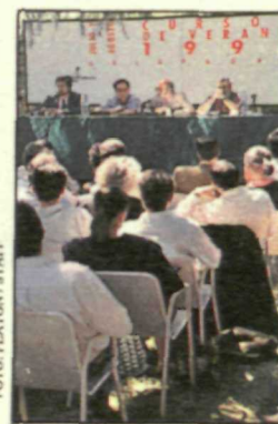
El PSOE ya tiene diseñado el programa de sus cursos de verano

La edición de 1993 se abrirá, a finales de junio, con sendos cursos que, dirigidos por el secretario