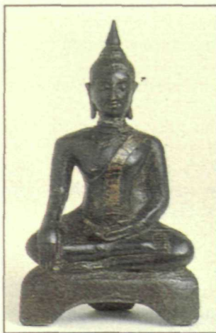
Asia contará con una sala exclusiva en el Museo.