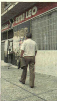
La cobertura de desempleo se ha situado ya en el 68,1% a finales de 1992.

En 1982 el Gobierno socialista heredó una tasa de cobertura del 26%, desde entonces el sistema español de protección por desempleo ha experimentado un aumento ininterrumpido.