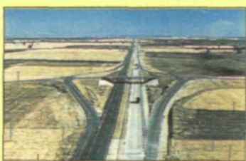
El Plan Director de Infraestructuras es una inversión en el futuro de nuestro país.

El esfuerzo de negociación de Felipe González en la cumbre comunitaria de Edimburgo, en diciembre pasado, por obtener para nuestro país una cantidad sustancial de los Fondos de