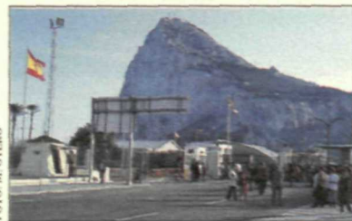
Gibraltar, un contencioso anacrónico.

En cuanto al derecho de autodeterminación que el dirigente gibraltareño, Joe Bossano pide para el