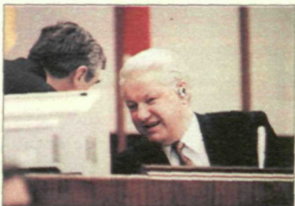
Boris Yeltsin durante una de las sesiones del Congreso de los Diputados Populares.

L a pugna por el poder que desde el pasado año mantienen el presidente de la Federación Rusa, Boris Yeltsin, y el presidente del Sóviet Supremo, Ruslán Jasbulatov, ha alcanzado una situación crítica. Yeltsin podría ser destituido tras el dictamen del Tribunal