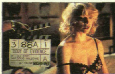
Madonna, protagonista total en «El cuerpo del delito».

como protagonista total, se sigue la línea de «Atracción Fatal» o «Instinto Básico». La transgresión de la pauta establecida por la timorata sociedad estadounidense —al menos en temas de sexo—, puede llegar a ser peligrosa hasta sus últimas consecuencias: el sexo como arma mortal.