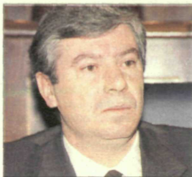
José Luis Corcuera, ministro de Interior.

En posterior rueda de prensa Corcuera destacó que «la sociedad democrática ha vencido políticamente a ETA» y, aunque constató que en los últimos meses la or-