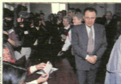
Michel Rocard, momentos antes de depositar su voto en las pasadas elecciones francesas.

Por otra parte, también se han celebrado elecciones en Australia.