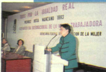
Matilde Fernández explicó las líneas de acción del Gobierno en materia de igualdad de la mujer.