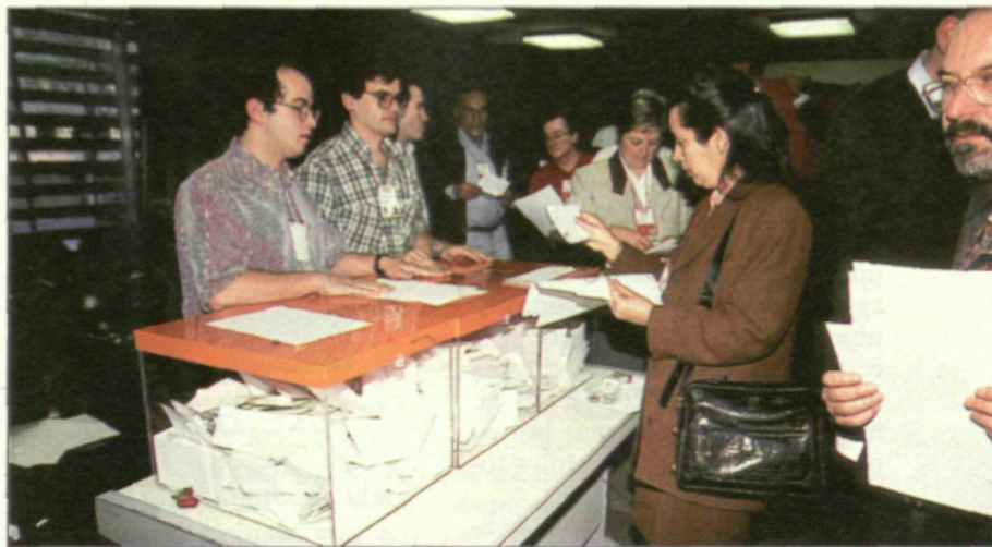
Por primera vez, la Ejecutiva Federal se eligió mediante voto individual y secreto de todos los delegados en el Congreso.

Por lo que respecta al protagonismo cobrado por las mujeres