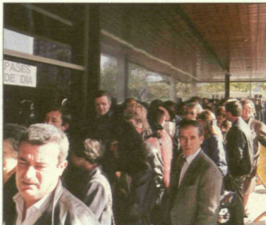
Cientos de militantes se han acercado al Palacio de Congresos para seguir el desarrollo de la cita socialista.

Estoy seguro de que vamos a aproximar más nuestro modelo de Partido a las normas ideales de una democracia profunda y equilibrada en sus poderes. Pero a quienes nos observan, y algunas veces nos acechan desde las talanqueras, les recuerdo que no deben olvidar que si queremos ser un colectivo de proposición y acción también somos prioritariamente una fuerza de lucha, con todos los condicionantes que ello impone. Un Congreso es escenario para la síntesis de un debate abierto meses an-