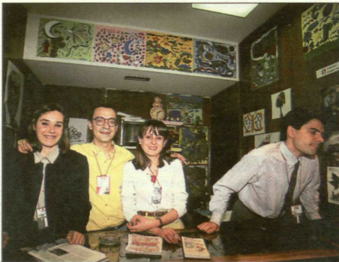
El stand de las Juventudes Socialistas fue uno de los más visitados.