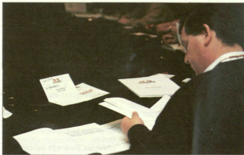
Los delegados debatieron un millar de enmiendas presentadas al capítulo del «Impulso Democrático».

san por fomentar el asociacionismo, dotar de mayor transparencia a la política de nombramiento de cargos públicos y fomentar la participación de los emigrantes en los procesos electorales que se celebren en nuestro país.