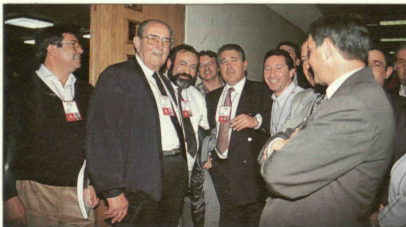
Los delegados mostraron su satisfacción por el resultado del Congreso.