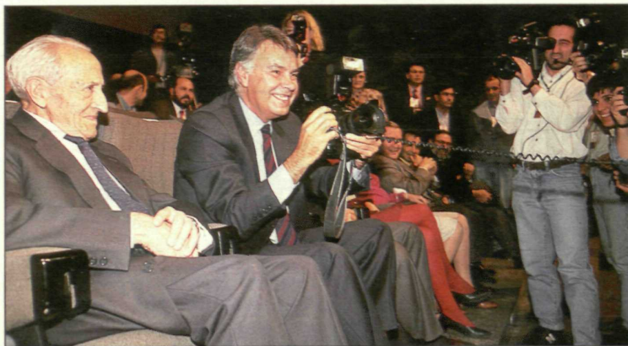
González bromeando con los periodistas durante una de las sesiones de la convocatoria socialista.

Si hubo unanimidad y consenso en la aprobación de las resoluciones, y, por tanto, en la definición de la estrategia del PSOE a medio y largo plazo, éstos tampoco faltaron en la valoración que el conjunto de los delegados hizo del trabajo realizado por los órganos de dirección salientes en este Congreso.