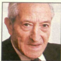
Presidente Ramón Rubial

Es presidente del Partido Socialista desde 1976, año en el que fue elegido para este cargo durante el XVII Congreso Federal. Ha sido presidente del Consejo General Vasco desde febrero de 1978 hasta 1980. Asimismo, es senador por Vizcaya desde 1977.