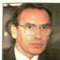
Vicesecretario general Alfonso Guerra

Desempeña este cargo desde el Congreso Extraordinario del PSOE, celebrado en septiembre de 1979. Diputado por Sevilla desde la primera legislatura constituyente (1977), ha sido vicepresidente del Gobierno desde diciembre de 1982 hasta enero de 1991.