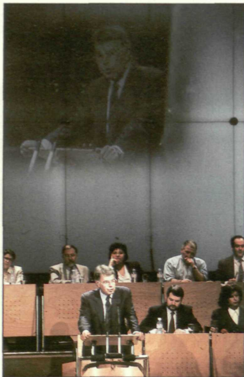
Felipe González pidió a los delegados que se expresaran con sinceridad y que unieran voluntades para llevar adelante el proyecto socialista.