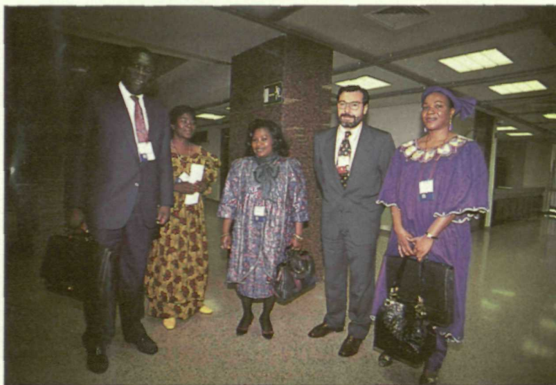
En la fotografía, el ministro del Interior, Antoni Asunción, con una delegación de invitados internacionales.