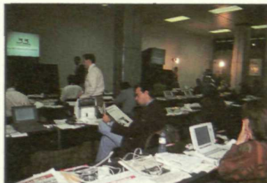
Centro de prensa donde trabajaron los profesionales de la información.

E l bullir en el Palacio de Congresos fue constante durante los tres días que duró la cita congresual socialista. Más de 4.000 personas, entre invitados nacionales e internacionales, observadores, delegados, periodistas (estaban acreditados más de 300 en nuestro país y el resto del mundo) y personas que han trabajado en la organización del Congreso (cerca de mil) para que todo estuviera a punto. Allí se instalaron en pocos días telefax, máquinas fotocopiadoras, ordenadores, terminales, impresoras y el equipo informático necesario para el recuento de votos y los trabajos en Comisión. Asimismo se dispuso de un circuito cerrado de televisión, con monitores distribuidos por las distintas zonas del Palacio de Congresos, así como de una pantalla gigante para el seguimiento de las sesiones plenarias en el Auditorio B, destinado a los observadores.