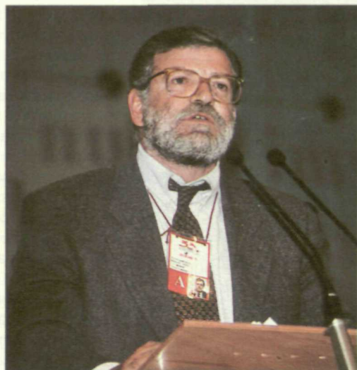
Rodríguez Ibarra destacó la necesidad de ofrecer a la sociedad un proyecto colectivo