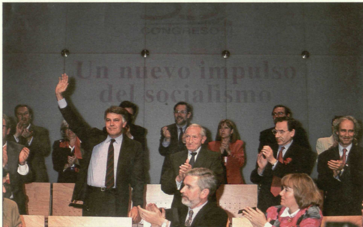
Felipe González, junto a la nueva Ejecutiva, saluda a todos los asistentes al 33 Congreso.

Si la Comisión Ejecutiva Federal elegida en el Congreso presenta novedades en cuanto a su composición, también ha sido nuevo el sistema adoptado para su conformación y elección. Rompiendo con el trámite que se siguió en citas congresuales precedentes, mediante el cual se presentaba una candidatura y ésta se sometía directamente a la consideración del Congreso, en