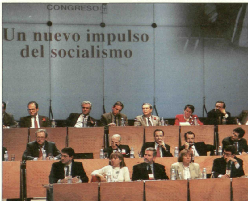
La Mesa del Congreso moderó los debates en el plenario.

L os delegados asistentes al 33 Congreso Federal del PSOE aprobaron un comunicado presentado, entre otras, por las delegaciones de Cataluña, Madrid, Murcia, América, Jaén y Almería, y que fue leído ante el plenario por el presidente de la Mesa del Congreso, Joan Lerma , en el que se pide que se constituya un foro de debate en el que los inmigrantes puedan dejar oír sus posiciones. El comunicado expone que la única política defendible como posible y positiva para los inmigrantes se basa en una triple estrategia. En primer lugar, por un racional control de flujos que se justifiquen en sí mismos por el hecho de impedir la creación de marginación social, de otro lado difícil de evitar en la actual coyuntura de nuestro mercado de trabajo. En segundo lugar, por una integración global del inmigrante establecido que no olvide ninguna de sus dimensiones posible. Y por último, por un compromiso ambicioso para con la cooperación al desarrollo de aquellos países que son origen y causa de nuestra inmigración. Finalmente, el comunicado hace un llamamiento al Gobierno para que determine la necesaria estrategia de actuación pública que trate de conseguir la más completa integración del inmigrante en nuestra sociedad.