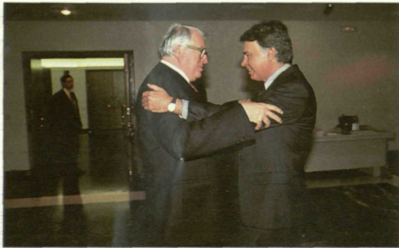
Pierre Mauroy y Felipe González saludándose durante el Congreso.

Asimismo, otro de los invitados internacionales que hizo uso de la palabra fue el presidente del SPD alemán, Rudolf Scharping , quien abogó por la colaboración entre