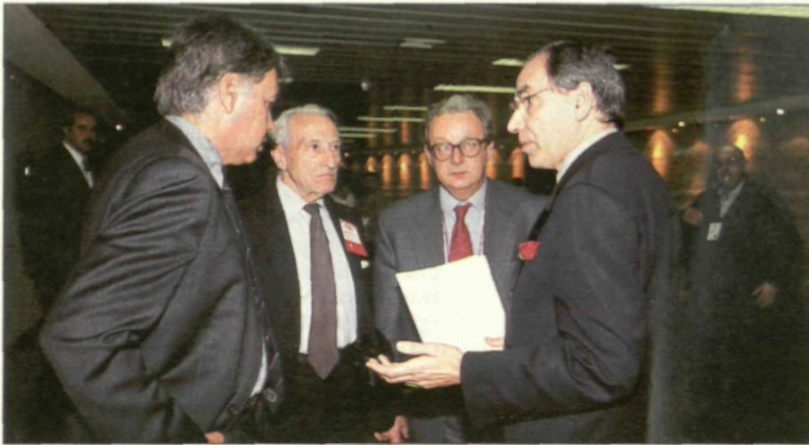
Ramón Rubial, Felipe González, Alfonso Guerra y José María Benegas cambian impresiones al inicio del Congreso.

ha tenido en el diseño de las políticas y estrategias futuras de este Partido.