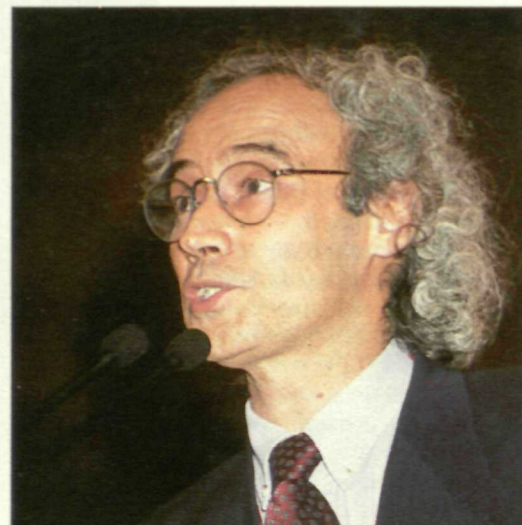
Garcés afirmó que las transformaciones sociales deben consolidarse en esta nueva etapa.