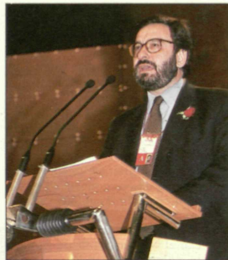
Narcís Serra, durante su turno de intervención ante el plenario

La delegación de Lugo, a través de su portavoz, José Blanco , hizo público su apoyo a la gestión de la Ejecutiva y dijo que el PSOE está obligado a dar respuestas a una difícil coyuntura económica y también a adoptar una nueva actitud «que haga entender a la sociedad que nuestro Partido ha cobrado un nuevo impulso». Igualmente, expresando su apoyo no «exento de dudas y preocupaciones» a la gestión, Juan Barranco afirmó que el PSOE tiene que abrir una nueva etapa par aumentar su conexión con la sociedad, desde la transparencia y actuar