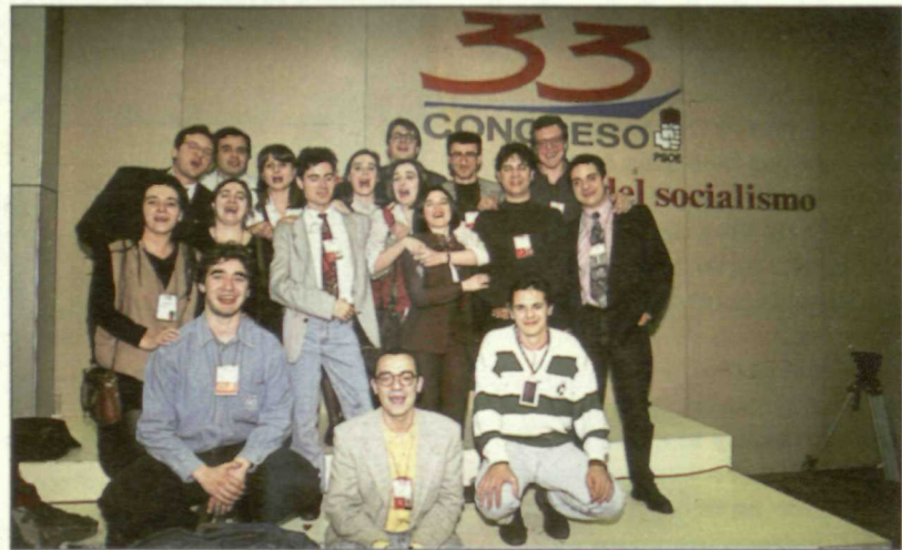
Los representantes de las JSE han conseguido que aumente su presencia en el Comité Federal y en la CEF.

Así ha quedado plasmada la adaptación del Partido a la realidad social, a una mayor participación de los jóvenes, sobre todo si tenemos en cuenta que éstos representan un 40 por 100 de la po-