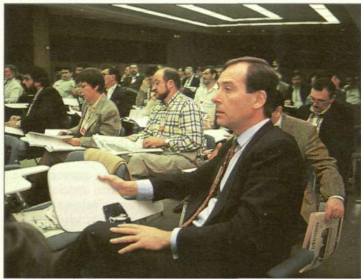
Los delegados siguieron con atención las intervenciones de todos sus compañeros.

el fortalecimiento de las estructuras organizativas de estos grupos sectoriales, sino que también garantizan el que estas organizaciones puedan hacer oír su voz en todos los procesos de toma de decisiones en cualquiera de los niveles territoriales del PSOE.