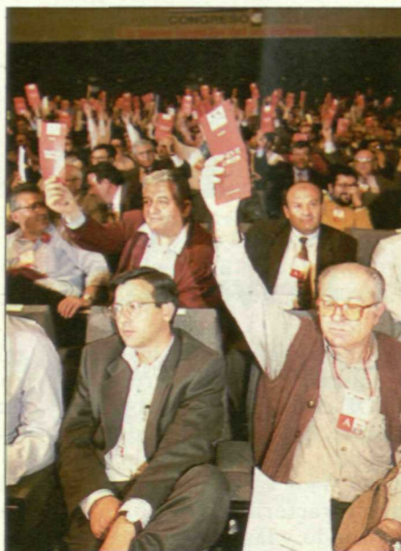
La gestión de la Ejecutiva saliente recibió el apoyo del 95 por 100 de los delegados.