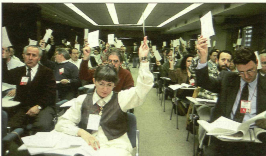
Las comisiones desarrollaron un intenso trabajo debatiendo la Ponencia Marco y las enmiendas presentadas a ésta.

Por lo que respecta a las incorporaciones, la más notable es la de Cipriá Ciscar , para ocuparse