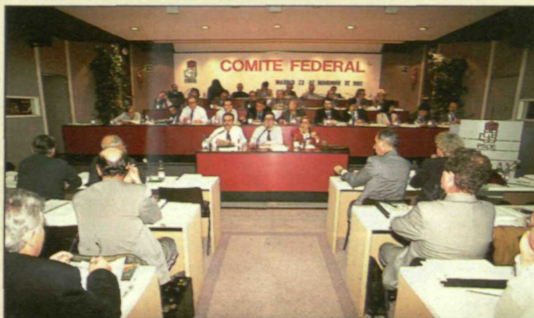
Los 39 miembros que corresponde elegir al Congreso para el Comité Federal tuvieron un respaldo del 90,92 % de los delegados.