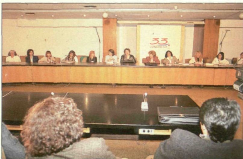
Las mujeres aumentaron su representación en los órganos de dirección y en las listas electorales.

Ahora con la nueva propuesta, recogida en los Estatutos Federales del PSOE, aumentará la representación de las mujeres socialistas en todos los órganos de dirección