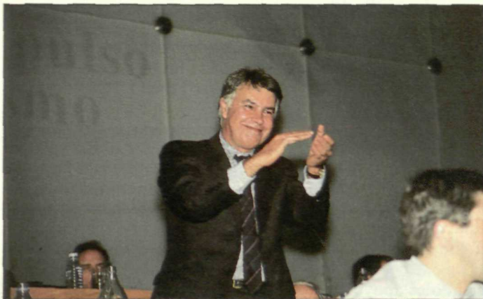
González felicitó a los delegados por su trabajo en el Congreso.

(...) Hay una visión del desarrollo autonómico en el que, naturalmente, tenemos un camino que recorrer, porque no estamos totalmente de acuerdo o no tenemos la misma concepción. Pero la verdad es que el comportamiento