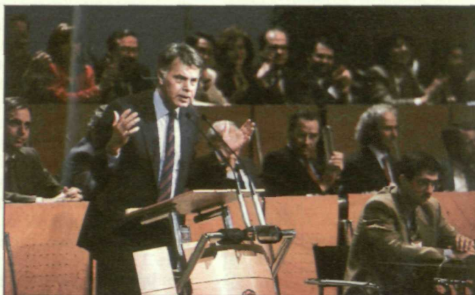
Felipe González, rodeado por la nueva Ejecutiva del PSOE, en la clausura del Congreso.

Hay que incentivar a las empresas nuevas y viejas para que contraten trabajadores. Para ello, hemos desbloqueado la contratación de trabajadores pertenecientes a los colectivos más afectados por el paro: a los jóvenes no cualificados, a través de los contratos de aprendizaje; a los jóvenes con formación y sin