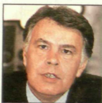
Secretario general Felipe González

Desde el Congreso de Suresnes, celebrado en octubre de 1974, ha sido reelegido para este cargo en los sucesivos Congresos del PSOE. Diputado por la circunscripción de Madrid desde 1977, es presidente del Gobierno desde las Elecciones Generales de octubre de 1982.