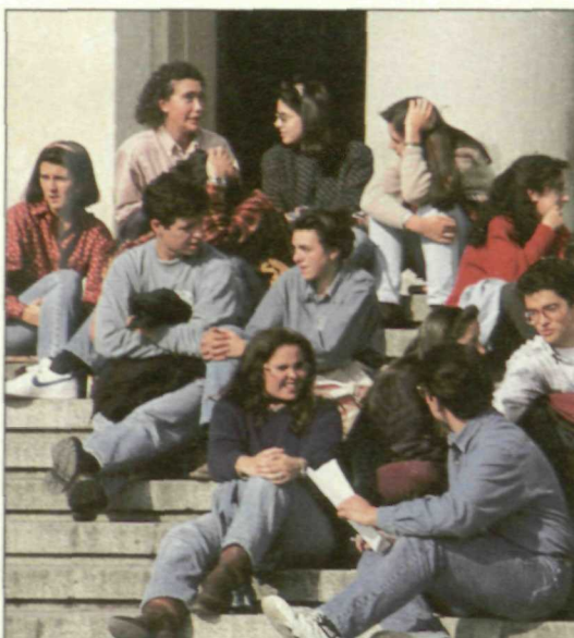
Los jóvenes de los 90 son la primera generación que ha crecido y se ha educado en democracia.

La política para nosotros tiene unos condicionantes, unos riesgos y unas necesidades diferentes de las que caracterizaban hasta ahora las formas de hacer política. Por ello nuestra integración en las tareas orgánicas e institucionales constituye una prioridad inexcusable y constante. Esta incorporación, además de propiciar los cauces políticos precisos para que los jóvenes puedan desarrollar plenamente sus inquietudes