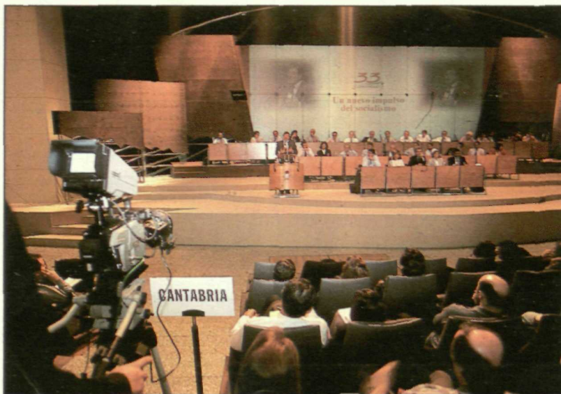
El debate de gestión se prolongó hasta bien entrada la noche del viernes 18 de marzo.

En turno de conformidad y como portavoz de los delegados