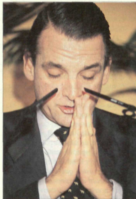
Conde "resucitó" en Antena 3