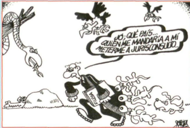
FORGES ("El País")