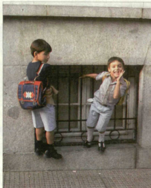
La vacunación contra la meningitis ha comenzado ya en la población comprendida entre 18 meses y 19 años