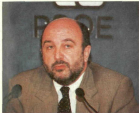
El secretario general del PSOE, Joaquín Almunia , analiza en un artículo la actual situación política (Pag. 8)