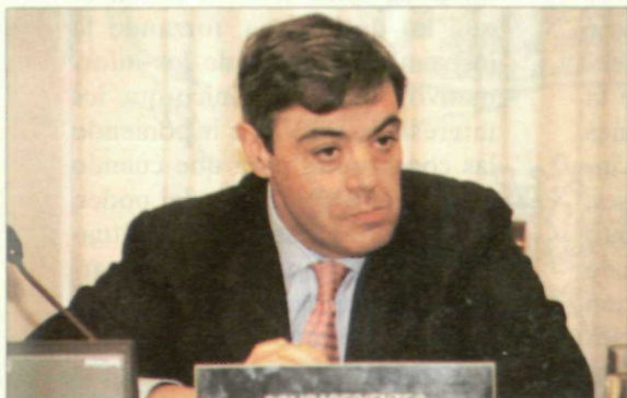
López Amor quiere imponer recortes de plantillas y sueldos

Hablando de derecho de réplica, los telediarios de Sáenz de