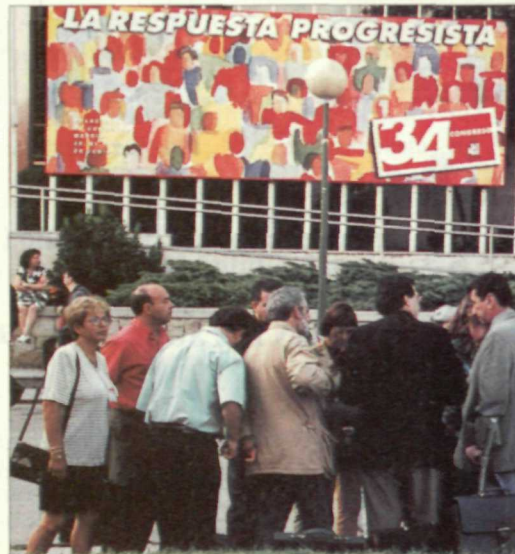
El Socialista incluye en este número el texto íntegro de las resoluciones aprobadas en el 34 Congreso (Pag. 27)