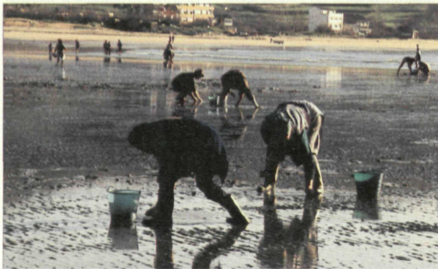
Los intereses pesqueros y agrícolas de Galicia no son suficientemente defendidos ante Bruselas

Asimismo, en el apartado de las instituciones hay que decir que en Galicia no existe control parlamentario. Una modificación unilateral del PP del Reglamento de la Cámara gallega permite al presidente del Gobierno autónomo comparecer una sola vez cada año,