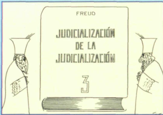
MAXIMO ("El País")