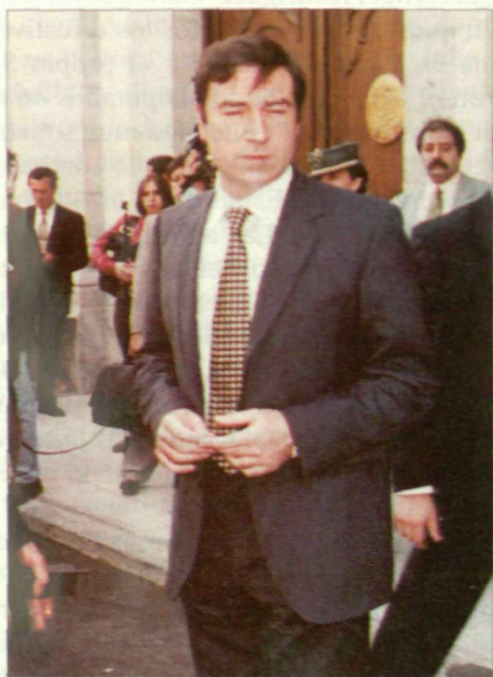
Pedro J. Ramírez, director de "El Mundo"

Al margen de cuales puedan ser las consecuencias futuras de la reunión entre el secretario general del PSOE y Aznar , lo cierto es que el PSOE es verdaderamente crítico con el balance de lo hecho hasta la fecha por el Gobierno en materia de justicia. En un informe elaborado por el Grupo Parlamentario Socialista en torno al pe-