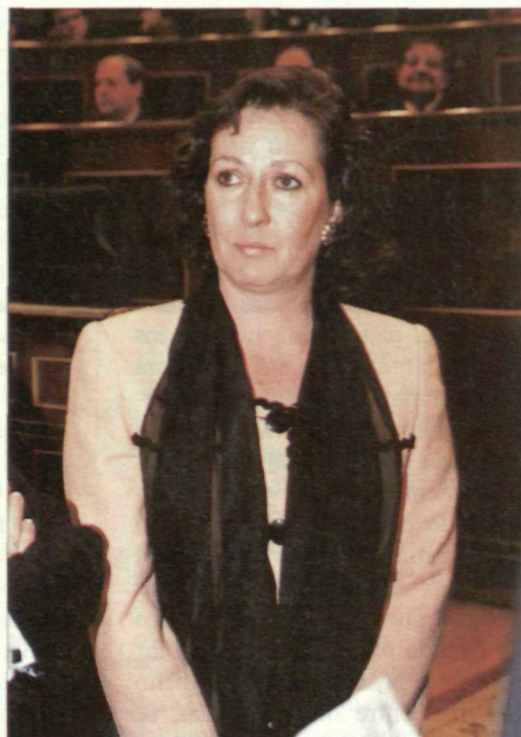
La ministra de Justicia acumula error tras error, a juicio del PSOE

Igual que con buena parte de los jueces que están enojados con el PP por crear "un ambiente de crispación política en detrimento de la administración de justicia", al Gobierno de Aznar tampoco le van nada bien las cosas con los fiscales. La Unión Progresista de Fiscales -apoyada por la Asociación de Fiscales y Jueces para la Democracia- ha denunciado, ante las autoridades de la Unión Europea, cómo "desde la victoria electoral del PP" se ha procedido a la "destitución arbitraria" de cargos de responsabilidad en la fiscalía y a su