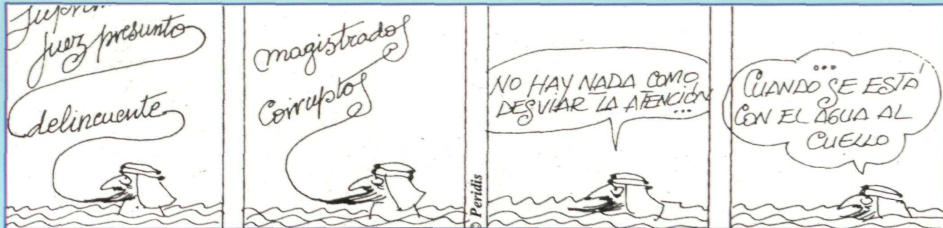
PERIDIS ("El País")