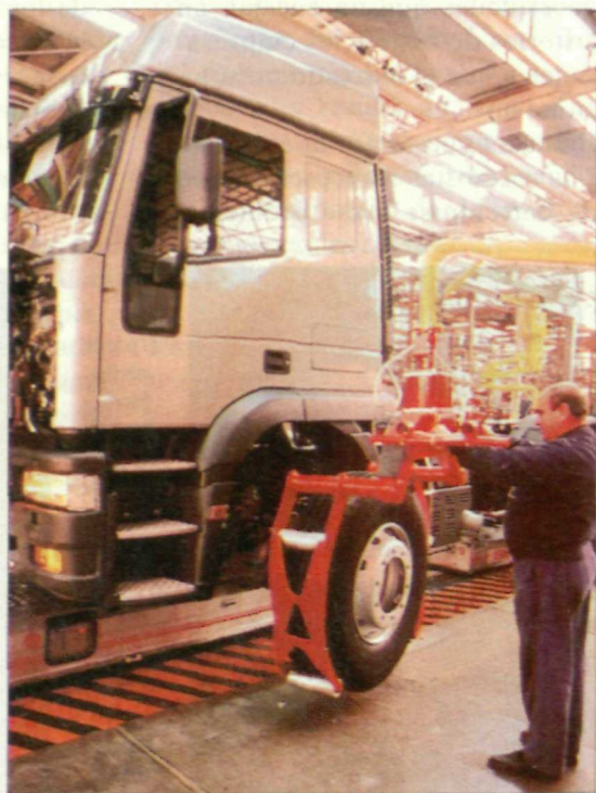
El plan plurianual de empleo de Aznar está basado en las subvenciones a los empresarios