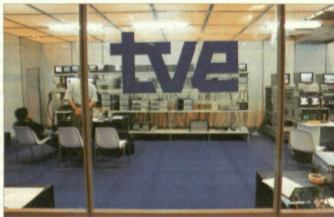
La manipulación informativa a favor del PP ha alcanzado cotas alarmantes

Bien es cierto que el PSOE tampoco alimenta demasiadas esperanzas respecto al papel de esta subcomisión. Diego Carcedo expone su total escepticismo al afirmar que "la subcomisión puede ser sólo una cortina de humo para distraer la atención del personal