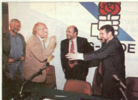
Las elecciones gallegas , en las que Abel Caballero encabeza la coalición entre el PSOE, Esquerda Unida y Os Verdes , representan el inicio de una nueva etapa en esta Comunidad (Pag. 18)