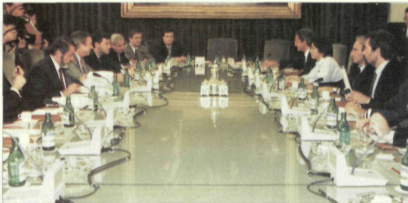
La unidad de los partidos democráticos es esencial en la lucha antiterrorista

En este caldeado ambiente, y no precisamente por el calor del verano, se situó la pretensión del Ministerio de Justicia de reducir la edad penal de 18 a los 16 años en casos de delitos de terrorismo, medida contemplada en un anteproyecto de ley que preparaba el departamento que dirige Margarita Mariscal de Gante . Ante este hecho, el PSOE, aunque reitera su voluntad de pactar con el Gobierno nuevas medidas legales contra el terrorismo, califica tal pretensión de "inconstitucional", en consonancia con la opinión de la mayoría de los partidos políticos y de cualificados y numerosos juristas. El propio Ministerio del Interior critica también la rebaja de la edad penal. En su opinión se trataría de aplicar una medida excepcional, frente a un Código Penal razonable y progresista. Esta cascada de