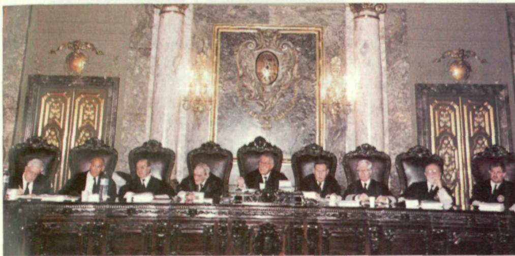
El Gobierno de Aznar y sus adláteres mediáticos están tratando de instrumentalizar a la justicia en su propio beneficio (Pag. 10)