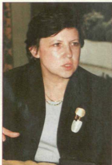
El primer ministro francés, Lionel Jospin, y la responsable de Empleo y Solidaridad, Madeleine Aubry, han puesto en marcha un ambicioso plan en favor del empleo

Jospin cumple así una de sus más destacadas promesas electorales, y su propuesta es de tal importancia que la oposición conservadora francesa no se ha atrevido a rechazarla frontalmente, sino que se ha limitado a exponer sus dudas sobre el futu-