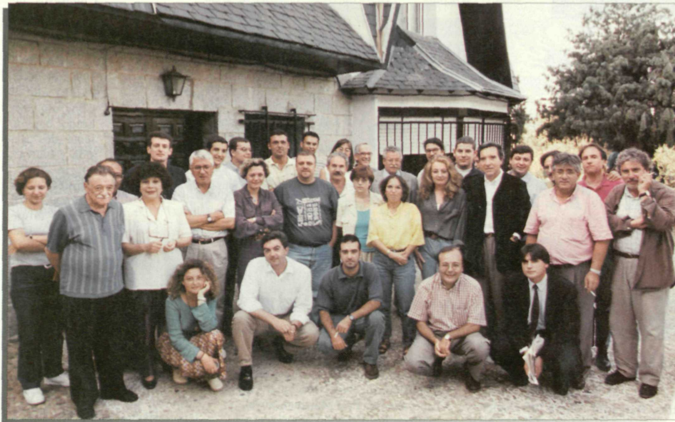
Profesores, ponentes y alumnos, entre los que se encontraba el escritor uruguayo Mario Benedetti, debatieron, en los Cursos de Verano del Partido Socialista, sobre la cultura y la tolerancia

Estar vigilantes ante la aparición de comportamientos intolerantes y rechazarlos como algo que no puede tener amparo en un sistema democrático, así como la reivindicación del feminismo como un pensamiento de izquierdas, han sido las principales conclusiones de los Cursos de Verano que el PSOE ha organizado en la Escuela Jaime Vera de la madrileña localidad de Galapagar