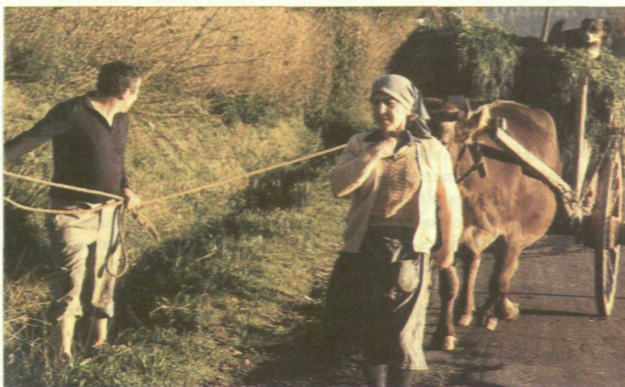
La agricultura gallega se caracteriza por su escasa productividad y el bajo nivel de rentas

Tanto el sector agrícola como el pesquero están dejados a su suerte por parte de la Xunta y del Ejecutivo central del PP. Sus intereses no encuentran valedor ante Bruselas por parte de la derecha. A principios de este año, el Gobierno de la Xunta tuvo que enfrentarse al malestar de los agricultores, que organizaron manifestaciones de protesta ante la Xunta y el Ministerio que dirige Loyola de Palacio , por su nefasta gestión en resolver las multas im-