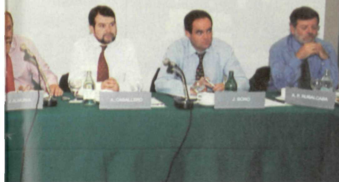
el Consejo Territorial del Partido Socialista mantuvo una reunión en La Coruña

seo de llegar a acuerdos con el Gobierno, aunque no ha ocultado su escepticismo con los resultados que sobre estas cuestiones puedan salir del encuentro. Aznar suele asentir a lo que sus interlocutores le plantean, pero actuar en el mismo sentido es otro cantar.