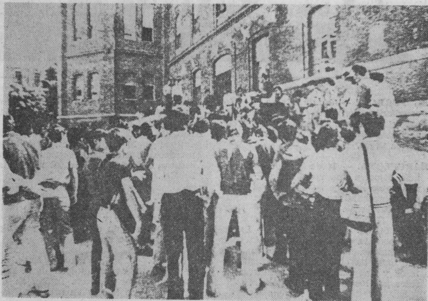
Centenares de españoles se congregaron en Lisboa. Un grupo de ellos aparece en esta fot en un mítin en plena calle lisboeta.

Un grupo de miembros de la dirección del P.S.O.E. han visitado Suecia por invitación del Partido Socialdemócrata Obrero Sueco. Han celebrado reuniones de trabajo con altas personalidades del Partido Socialista sueco y del Gobierno de Suecia, tratándose múltiples problemas como el futuro político de España, las rela-