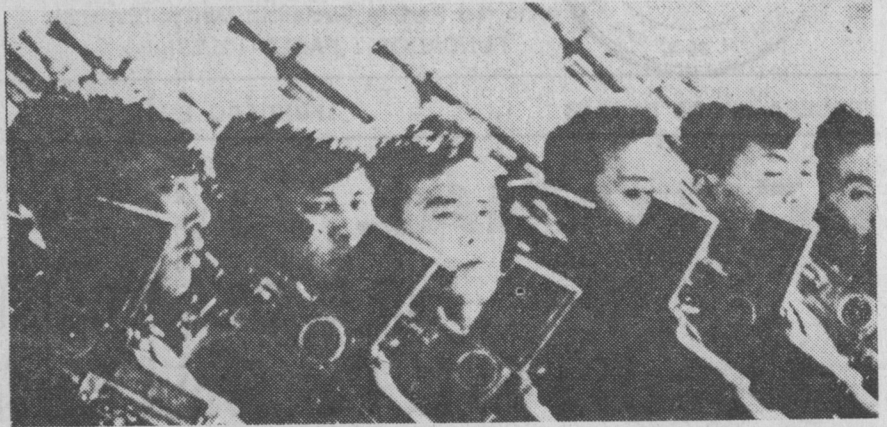
Una generación que nació en la guerra, y que hará la guerra hasta conseguir su libertad.

Camboya era el estado neutral dentro de la península, que se oponía a la utilización de su territorio como base desde la que perpetrar agresiones contra Viet-Nam del Norte. Ello acarrió el derrocamiento del Príncipe Norodom Sihanuk por una sublevación militar que colocó en el poder el servil pro-americano Lon Nol. Sihanuk, después de su derrocamiento, cambió rápidamente del autoritaris-