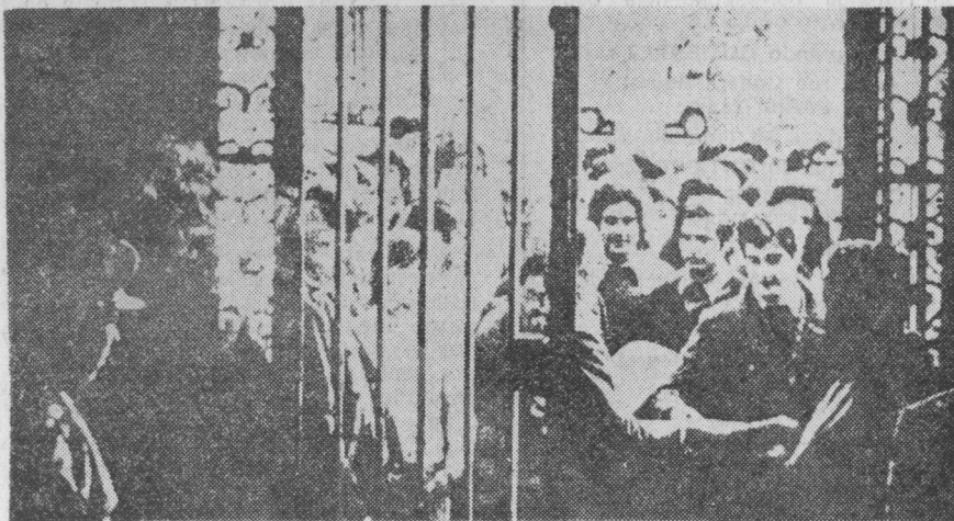
La policía cierra la Universidad, convirtiéndose de este manera en la única «autoridad» académica.

Desde hace tiempo, el régimen es consciente que ha perdido el control sobre la universidad. Ni las medidas disciplinarias ni la represión llevada a cabo por la policía han bastado para conseguir de nuevo dicho control. La única salida ha sido el recurso al cierre, en muchos casos indefinido, de Facultades y Universidades.