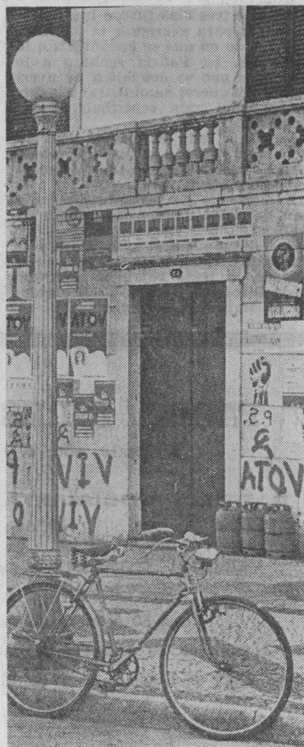
Los muros de Lisboa, y de todas las capitales portuguesas reflejaron el interés electoral.

Por fin, el pueblo español, ansioso de libertad y democracia sabrá juzgar el fenómeno portugués, y elegirá el futuro, el único futuro: el socialismo.