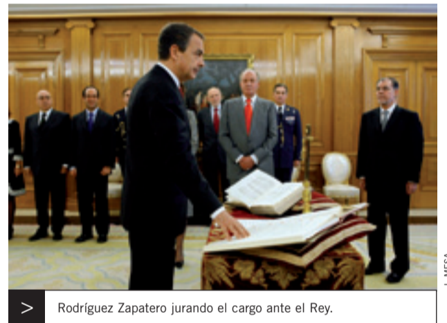
Rodríguez Zapatero jurando el cargo ante el Rey.