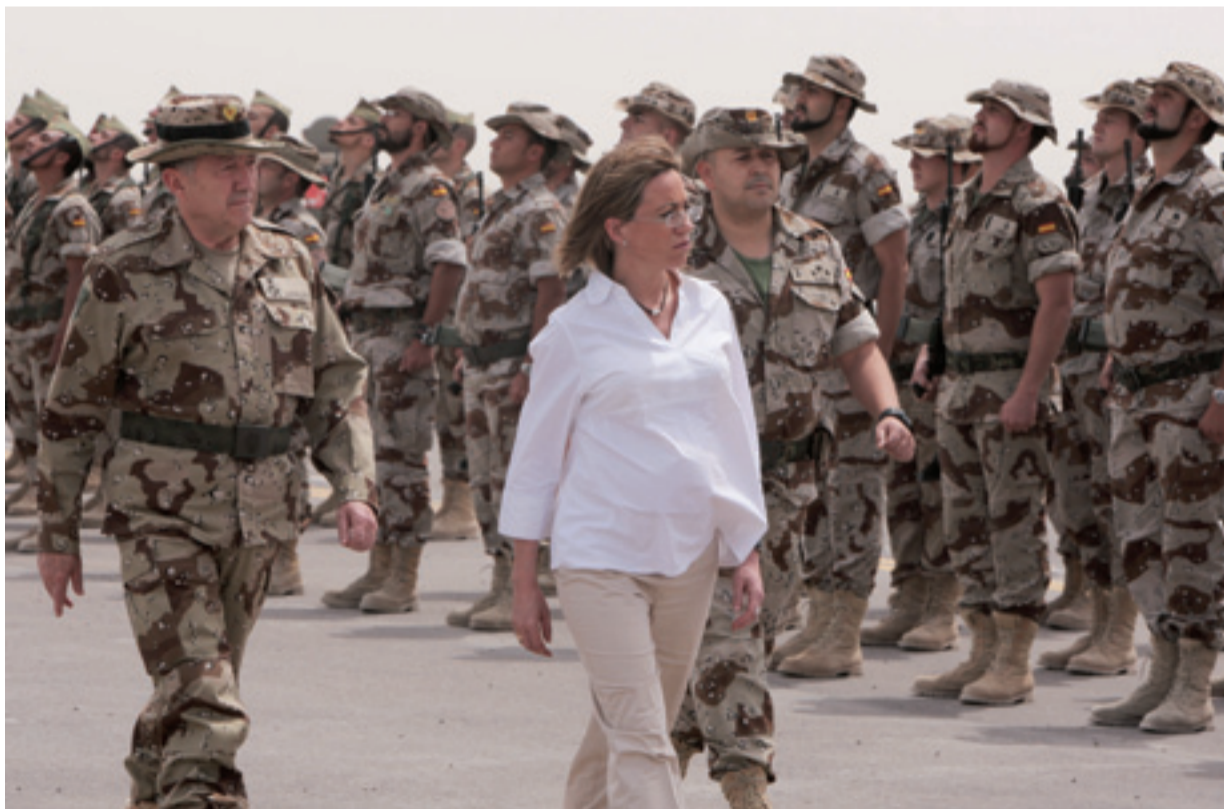
MINISTERIO DE DEFENSA

cometido, pero nuestras Fuerzas Armadas tienen asignada una misión constitucional que es fundamental. Una misión que es, por tanto, primordial y que para la cual trabajan a diario. Por tanto, podemos decir que nuestras Fuerzas Armadas trabajan para el mantenimiento de la paz y de la libertad tanto dentro como fuera de nuestras fronteras.