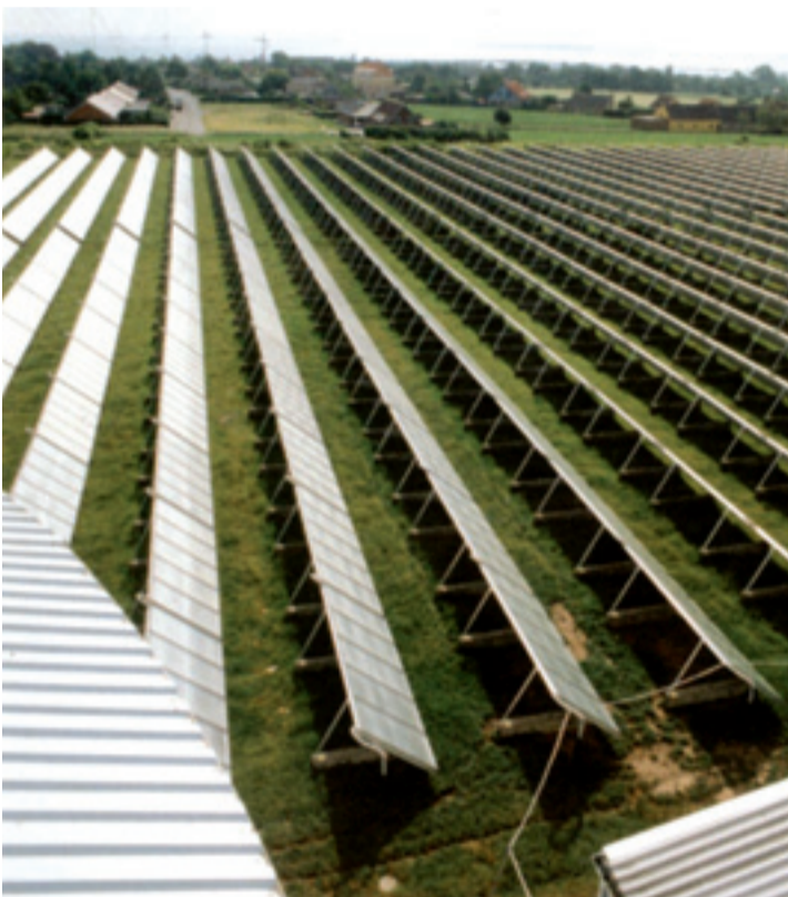
> La Presidencia española promoverá un nuevo modelo energético y de crecimiento.

mente euromediterráneo, con el impulso de la Unión por el Mediterráneo como uno de los principales ejes de la Presidencia en cuanto a acción exterior se refiere. El objetivo de la Presidencia española debe ser organizar y acudir a