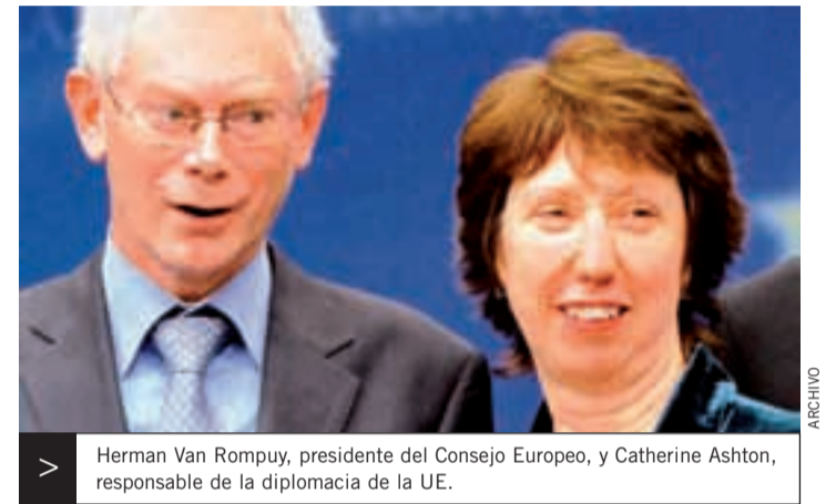
> Herman Van Rompuy, presidente del Consejo Europeo, y Catherine Ashton, responsable de la diplomacia de la UE.

8. La orientación del debate en las instituciones europeas, y en particular en el seno del Consejo, sobre la reforma del sistema de recursos propios y de gasto, que se plasmará en la Perspectivas Financieras 2014/2020, y el establecimiento de un nuevo marco financiero y la puesta en marcha de reformas de la Política Agraria Común y de la Política Pesquera Común que garanticen la viabili-