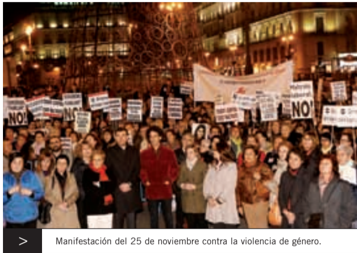
> Manifestación del 25 de noviembre contra la violencia de género.

Por ello, no podemos pasar por alto que quedan mensajes, patentes o soterrados en las familias, en la educación, en los medios de comunicación, en la publicidad, en la televisión, en los videojuegos, etc., que siguen retransmitiendo una imagen de la mujer que denigra profundamente su papel y su situación en la sociedad, que la