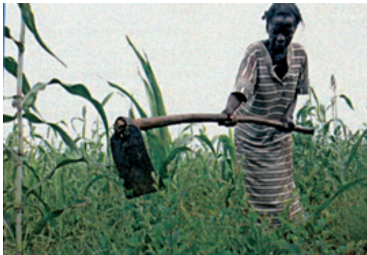
> La lucha contra la pobreza será una de las prioridades de la presidencia española.

La VI Cumbre Unión Europea-América Latina y Caribe, a celebrar en España, se abordará con la vocación de representar un cambio cualitativo en la asociación euro-americana, para lo que se aprobará un Plan de Acción sobre el que será tema principal de la Cumbre -tecnología e innovación para fomentar el desarrollo sostenible y la inclusión social- que deberá estar dotado de medios financieros ambiciosos y de mecanismos eficaces de seguimiento del cumplimiento de los compromisos asumidos. La Cumbre deberá lanzar el Mecanismo de Inversión en América Latina (LAIF) propuesto por la Comunicación de la Comisión del 30 de septiembre de 2009 y se avanzará en la creación de una Fundación Unión Europea-América Latina y Caribe. Otra prioridad de la Cumbre debe ser el compromiso firme de los Estados