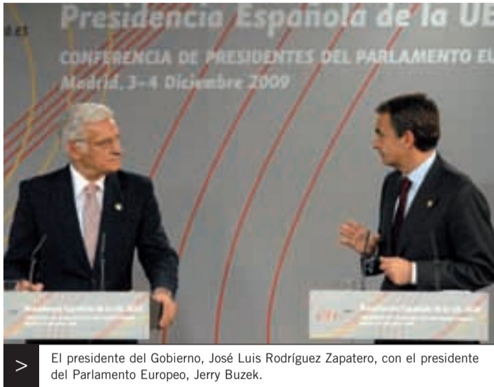
> El presidente del Gobierno, José Luis Rodríguez Zapatero, con el presidente del Parlamento Europeo, Jerry Buzek.

Igualmente, y por primera vez en la historia de la UE, habrá un logo común para el trío de países que presidirán la Unión Europea. España, Bélgica y Hungría compartirán un logo único, pero a la vez diferenciado por los colores de la bandera nacional de cada uno