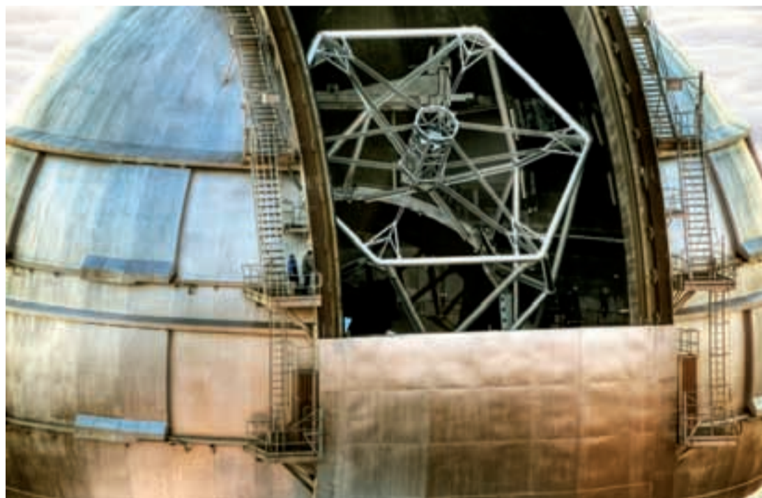
> EL Gran Telescopio Canarias es la mayor infraestructura científica jamás construida en España.

productivo e impulsen la innovación empresarial.