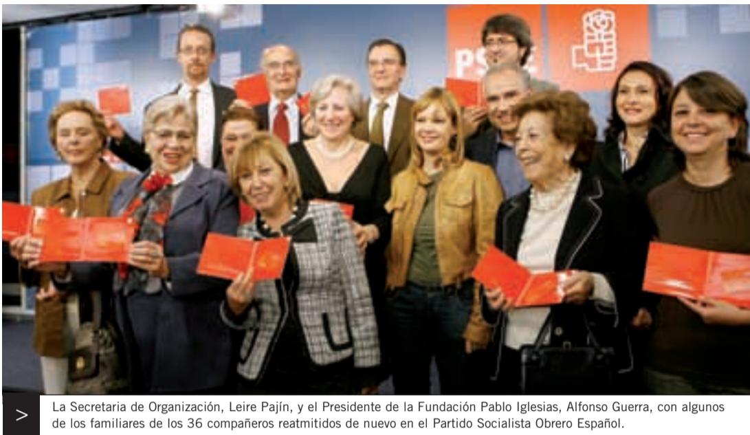
> La Secretaria de Organización, Leire Pajín, y el Presidente de la Fundación Pablo Iglesias, Alfonso Guerra, con algunos de los familiares de los 36 compañeros readmitidos de nuevo en el Partido Socialista Obrero Español.