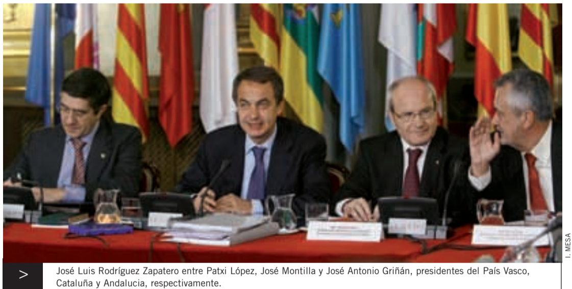
José Luis Rodríguez Zapatero entre Patxi López, José Montilla y José Antonio Griñán, presidentes del País Vasco, Cataluña y Andalucía, respectivamente.

mento que el presidente Zapatero presentará a los presidentes autonómicos sólo contendrá "líneas generales" para que después los grupos de trabajo, con presencia equilibrada de representantes autonómicos del PSOE y el PP, diseñen medidas más concretas. El vicepresidente tercero indicó que si Zapatero hubiera llevado a la reunión una propuesta "precisa y detallada" habría sido criticado por "presentar un hecho consumado". Junto al empleo y la lucha contra el déficit público, Chaves resaltó el interés del Gobierno en trabajar conjuntamente en el ámbito de la