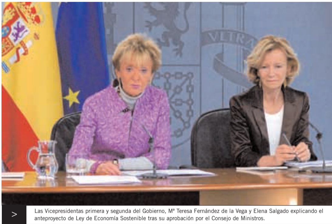
Las Vicepresidentas primera y segunda del Gobierno, Mª Teresa Fernández de la Vega y Elena Salgado explicando el anteproyecto de Ley de Economía Sostenible tras su aprobación por el Consejo de Ministros.

El anteproyecto de Ley, aprobado por el Consejo de Ministros días antes de la comparecencia del Presidente del Gobierno, forma parte del compromiso que hizo público Rodríguez Zapatero en el debate sobre el estado de la Nación y es voluntad del Gobierno abrir un amplio debate sobre los contenidos del mismo, que permita además incorporar las eventuales sugerencias de los agentes