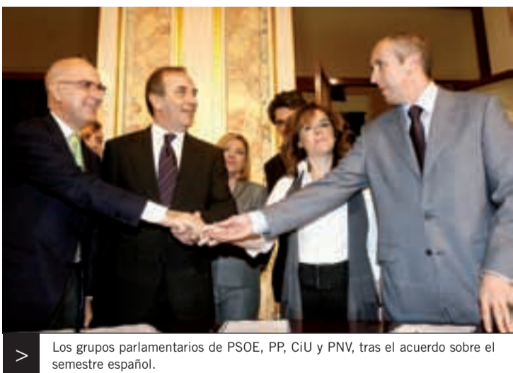
> Los grupos parlamentarios de PSOE, PP, CiU y PNV, tras el acuerdo sobre el semestre español.

7. Un nuevo modelo energético europeo para hacer frente al cambio climático y desarrollo de la política comunitaria de conservación de la biodiversidad.