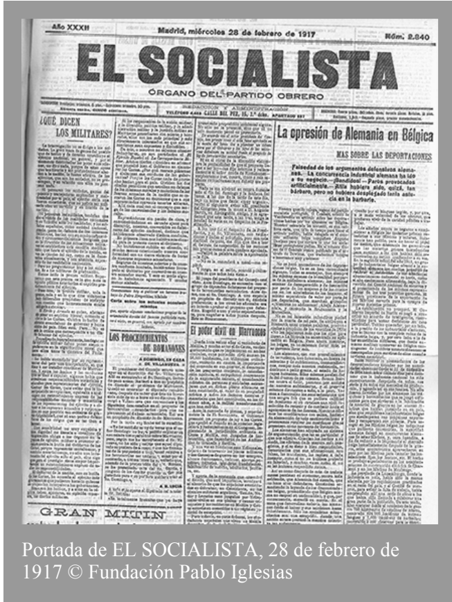
Portada de EL SOCIALISTA, 28 de febrero de 1917