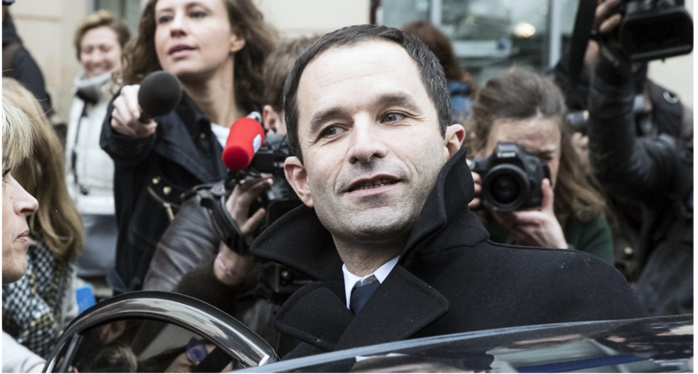
El candidato socialista a las presidenciales francesas, Benoît Hamon (c) / EFE