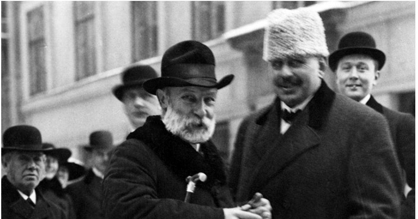
August Teodor Palm, activista socialista sueco