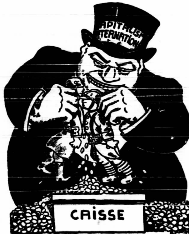
El capitalismo provoca las guerras para llenar sus arcas.